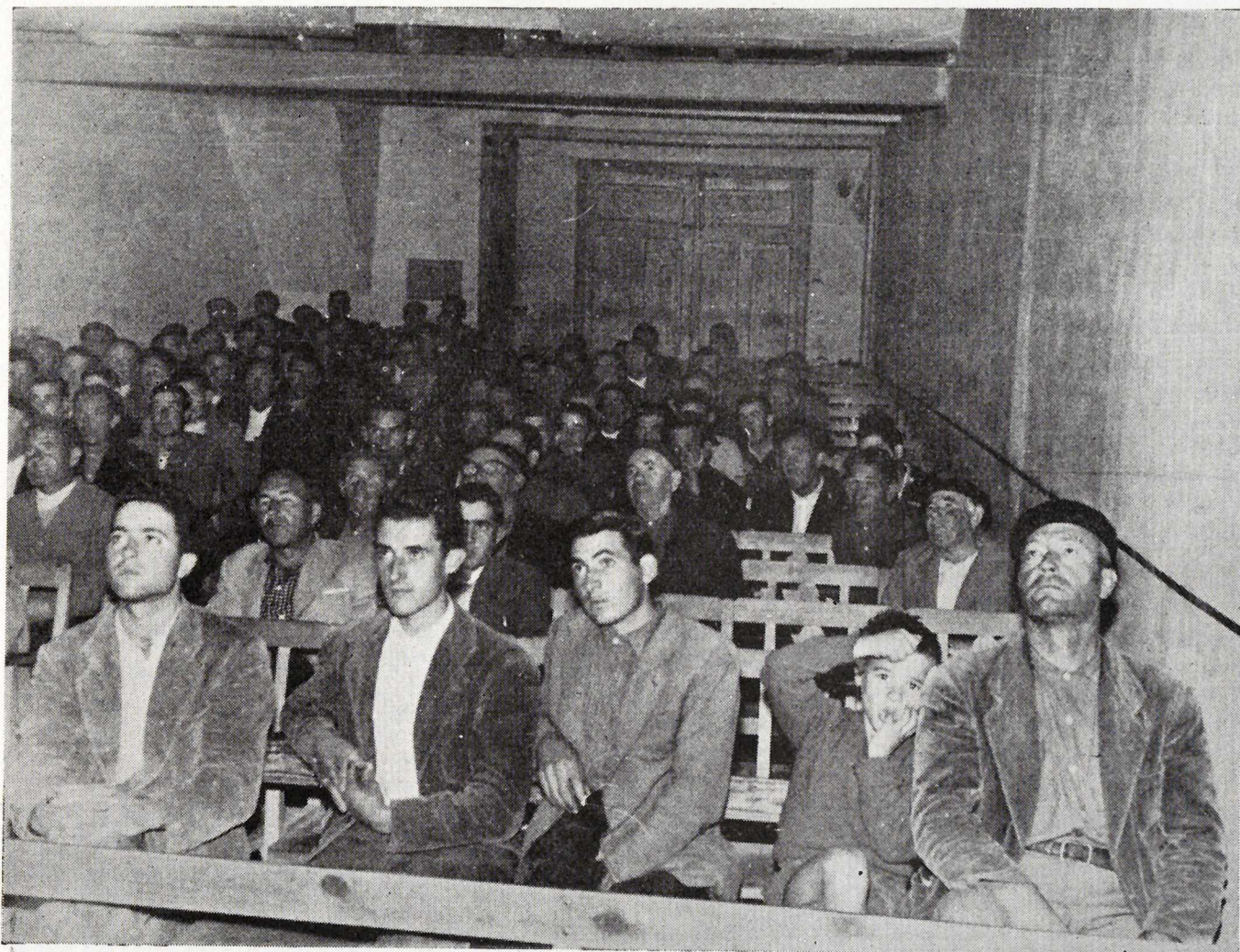
Reunión en Berbegal (Barbastro).

Se ha procedido al control de tres praderas de Bersim asociado al ballico; el rendimiento ha sido satisfactorio, pues oscila alrededor de los 20.000 kilogramos-hectárea de forraje verde.