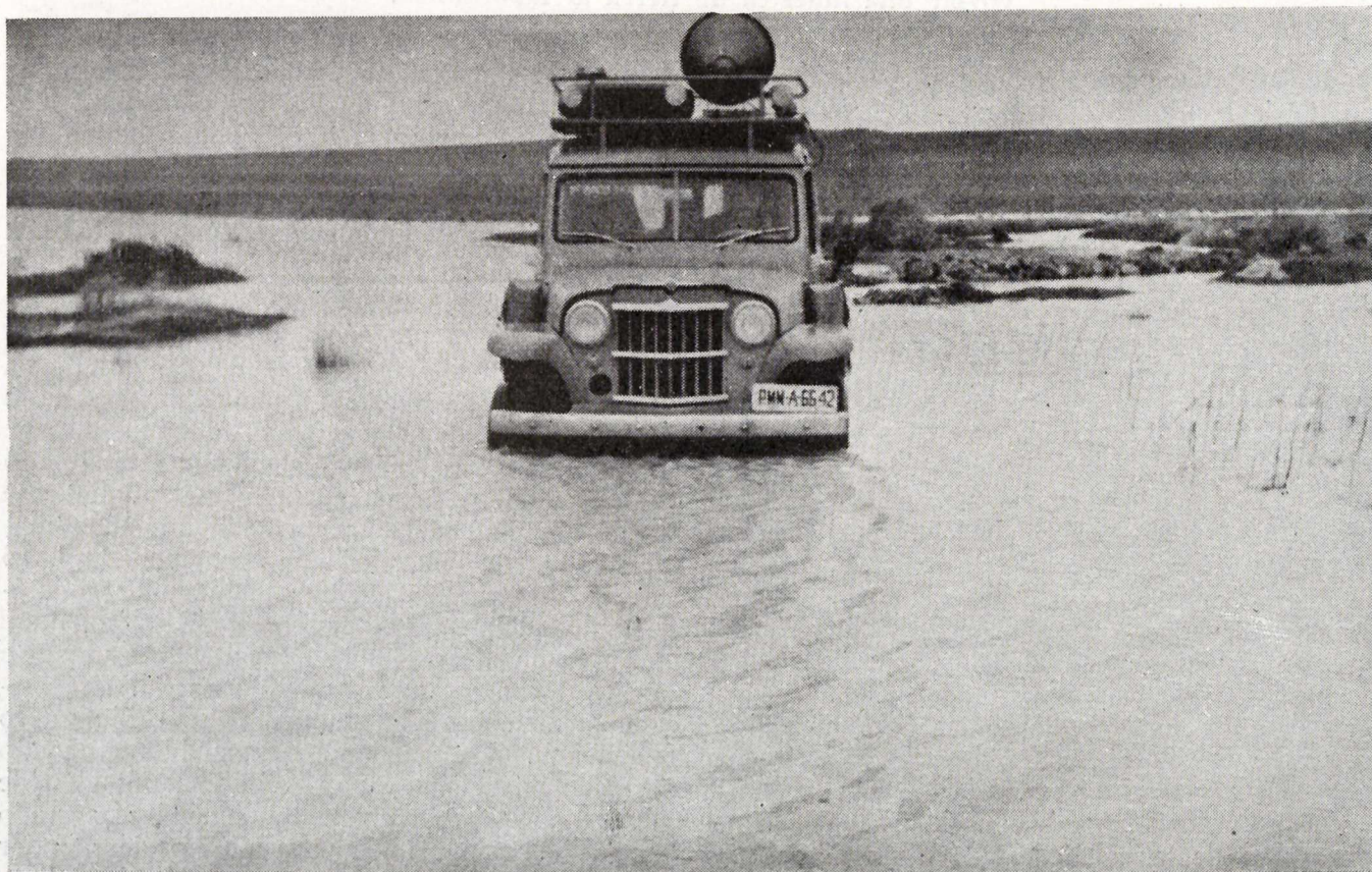
Otoño con mucha agua... Camino a Peñaranda.

La AGENCIA DE TORRELAVEGA (Santander), continuando el ciclo de reuniones sobre incremento de producción forrajera, en el presente mes ha celebrado 12 reuniones, con un total de 487 asistentes.