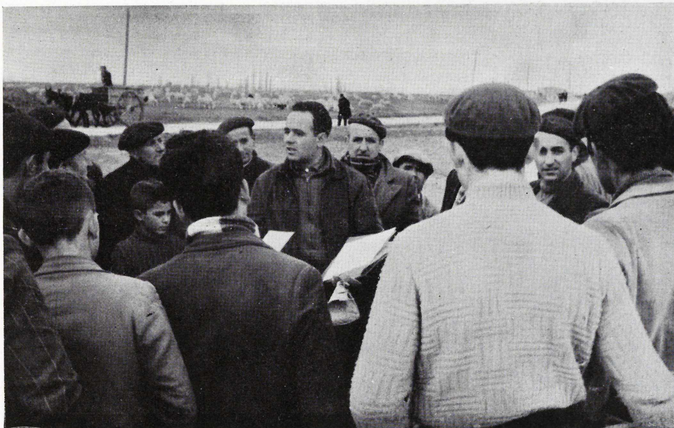
Peñaranda.--El Agente enseña la forma de rellenar el impreso de datos de campo para enviar una muestra de tierra al laboratorio.

campos de adaptación de patatas: una demostración de resultados sobre rendimientos de variedades de patatas seleccionadas, racionalmente abonadas, y una demostración de resultado de forraje ensilado. Se han celebrado también siete reuniones para dar a conocer los resultados obtenidos en los campos de demostración establecidos por la Agencia, sobre variedades de maíces híbridos para grano y forrajeros; una reunión sobre conservación del forraje por ensilado; una reunión sobre necesidad de vacunaciones, y una reunión sobre abonado del maíz.