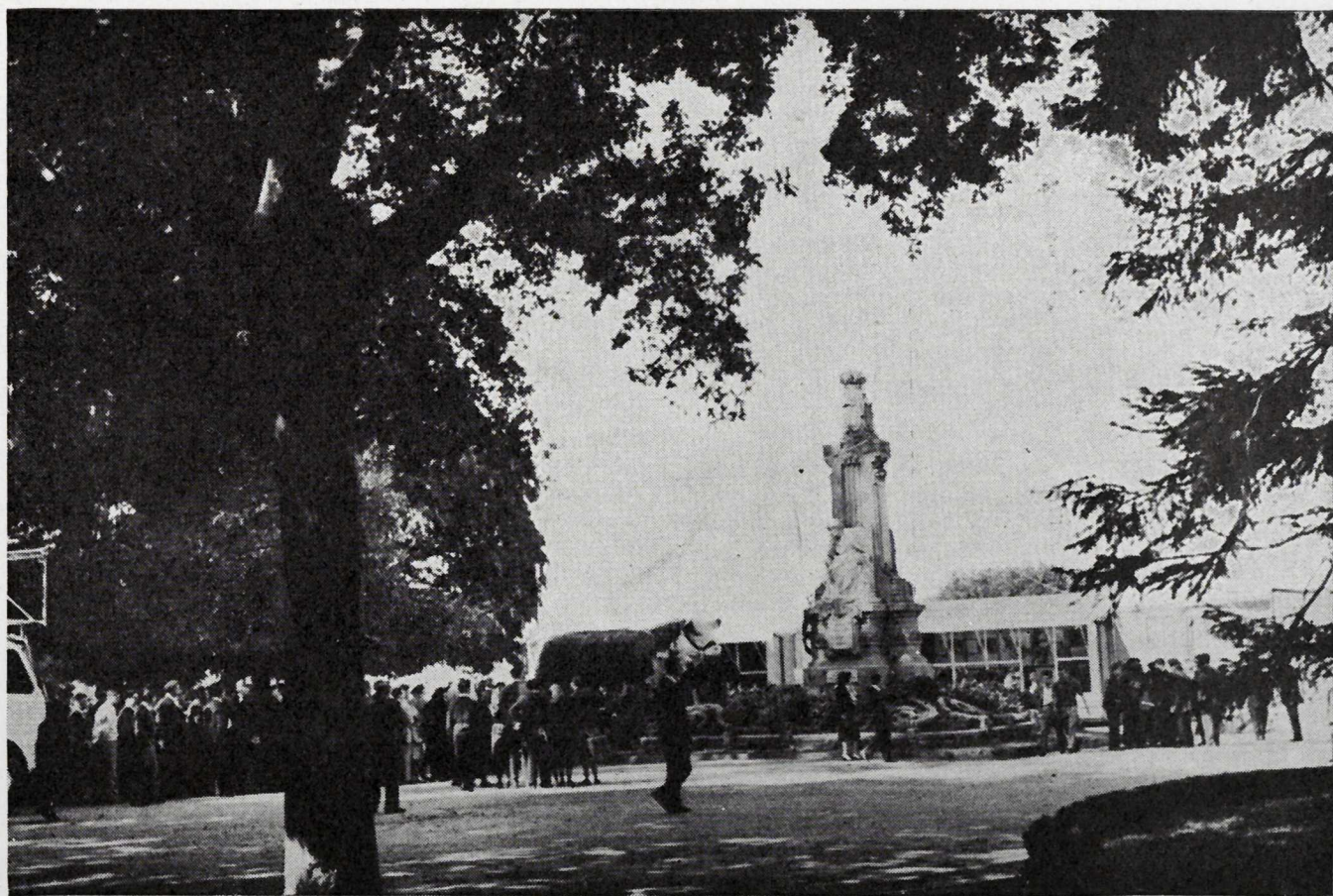
La Feria en Santiago de Compostela.