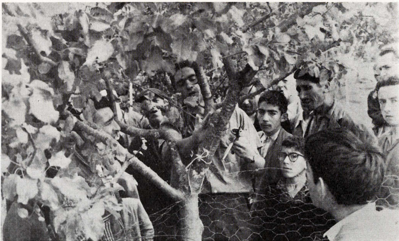
Porriño.—Con miras a la próxima campaña de invierno, el Agente de Extensión Agrícola asesora a los agricultores sobre la poda de sus frutales.

Catorce reuniones, con 2.264 asistentes; 26 demostraciones, con 721 asistentes; publicaciones distribuidas, 3.621; películas proyectadas, 23.