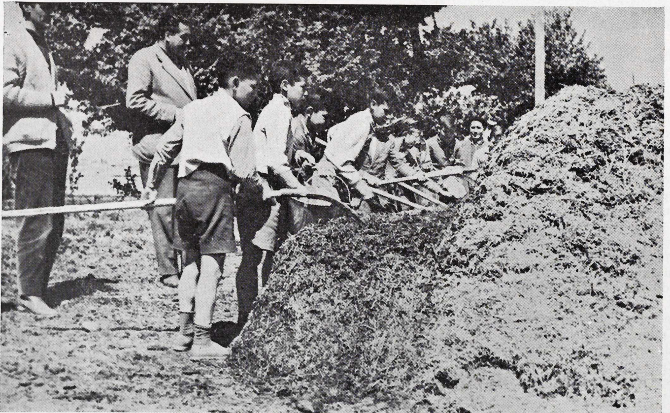
Medina del Campo.—Demostración de preparación de estiércol para cultivo de champiñón en un coto escolar.

En la clausura de los actos en Morales de