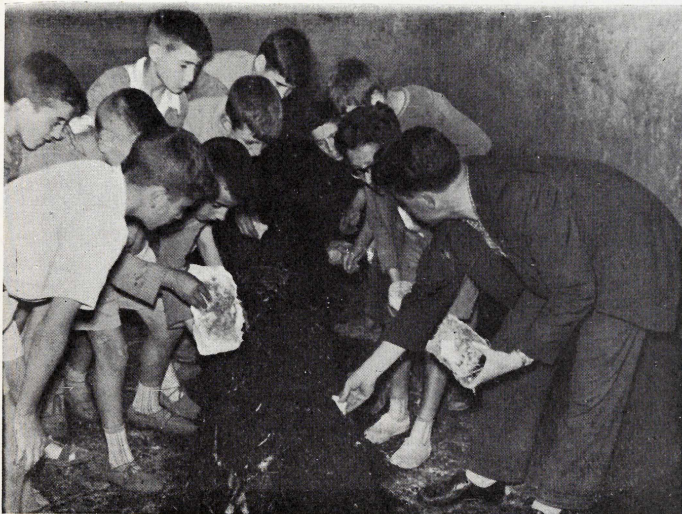
Medina del Campo.—Demostración de siembra del champiñón ante los niños de un coto escolar.

de las demostraciones efectuadas han sido celebradas en la caseta stand situada en el ferial de ganados de Valladolid, la cual fué establecida en colaboración con la C. O. S. A., el Excmo. Ayuntamiento y organismos provinciales dependientes del Ministerio de Agricultura. Igualmente han colaborado en el funcionamiento de dicho stand las Agencias de Medina del Campo y Castromonte.