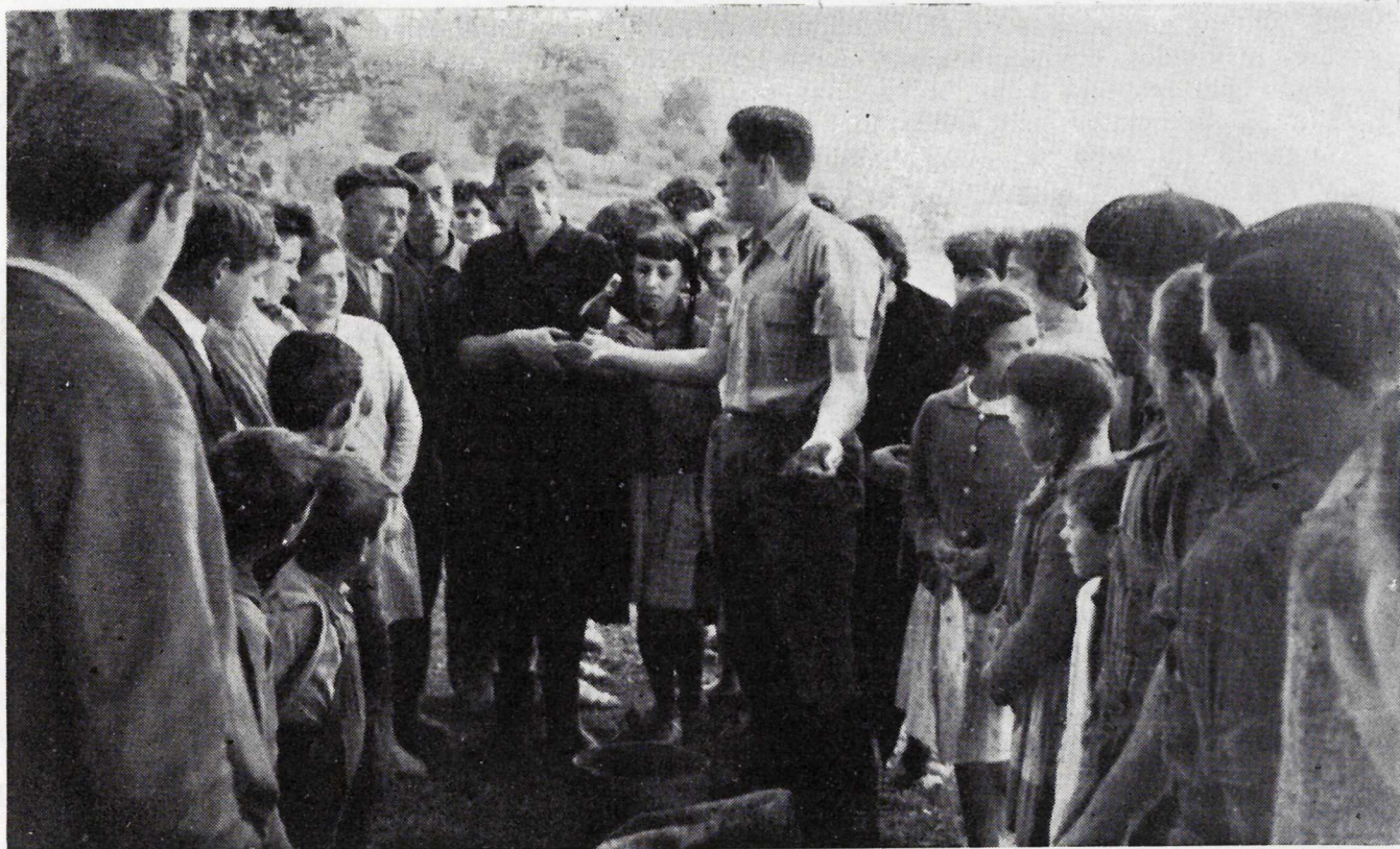
Porriño.—Demostración de abonado. El Agente muestra los diferentes abonos antes de mezclarlos.

Toro, intervinieron el Excmo. Sr. Gobernador Civil y Jefe provincial del Movimiento y el Subjefe provincial del Movimiento. En los demás pueblos actuaron la Inspección Provincial, la Regidora de Trabajo de la Sección Femenina y los Instructores de Juventudes, con el equipo de Ayudantes Audiovisuales del citado Organismo.