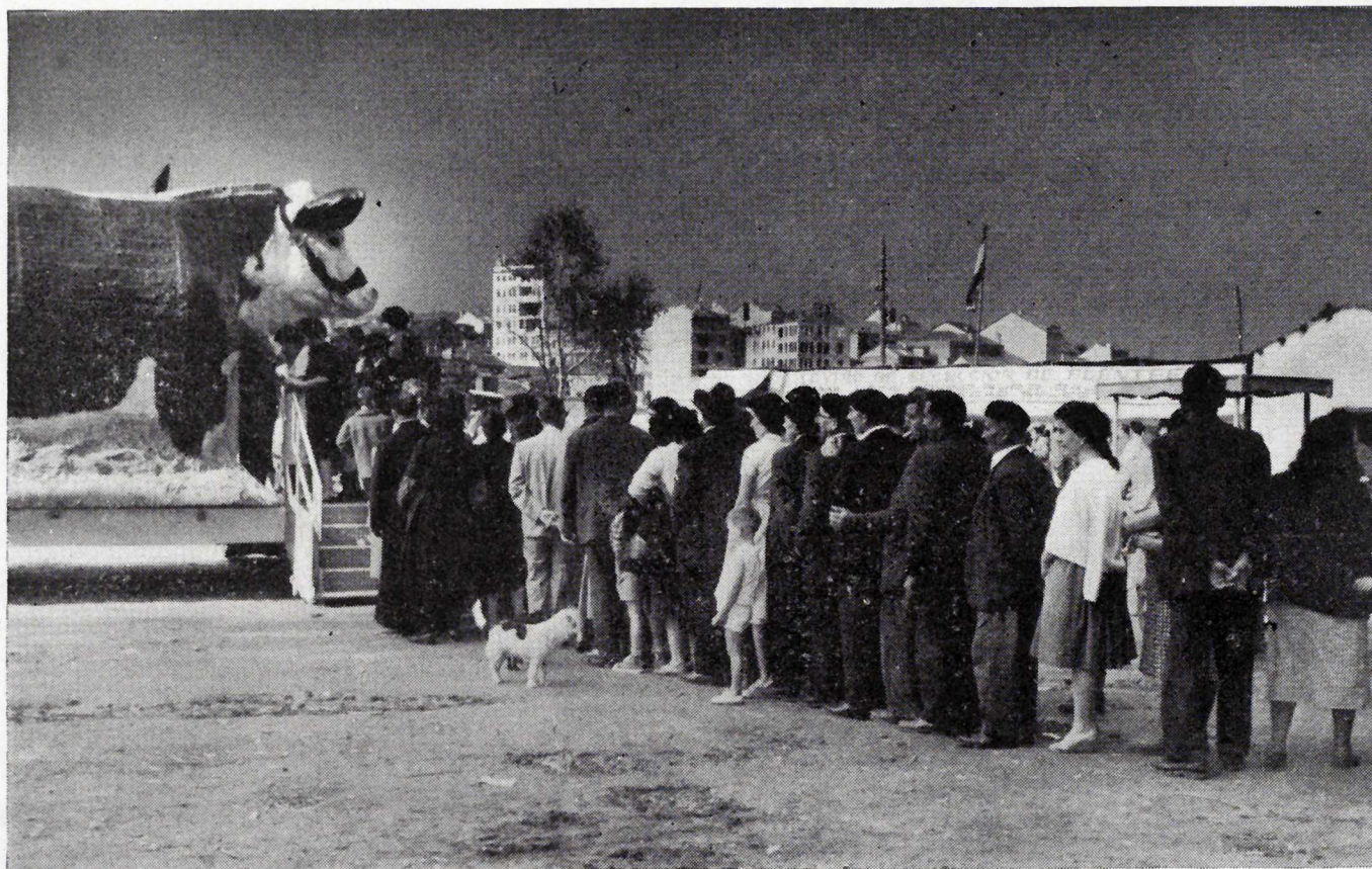
La Feria en Orense. Detrás de la fila de visitantes destaca el pabellón del Centro de Selección Fuentefiz.

varios ejemplares selectos del Centro de Mejora de la raza rubia gallega de Fuentefiz. Esto cumplió un gran fin educativo, al introducir la idea de selección junto con la de mejora de la alimentación.