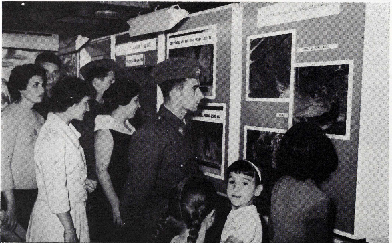
El público visita la Feria, contemplando con interés las fotografías y gráficos expuestos.