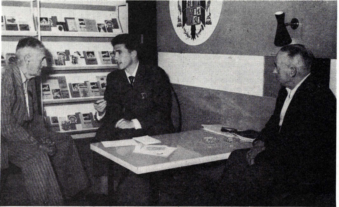
El personal de Extensión resolviendo consultas sobre alimentación.