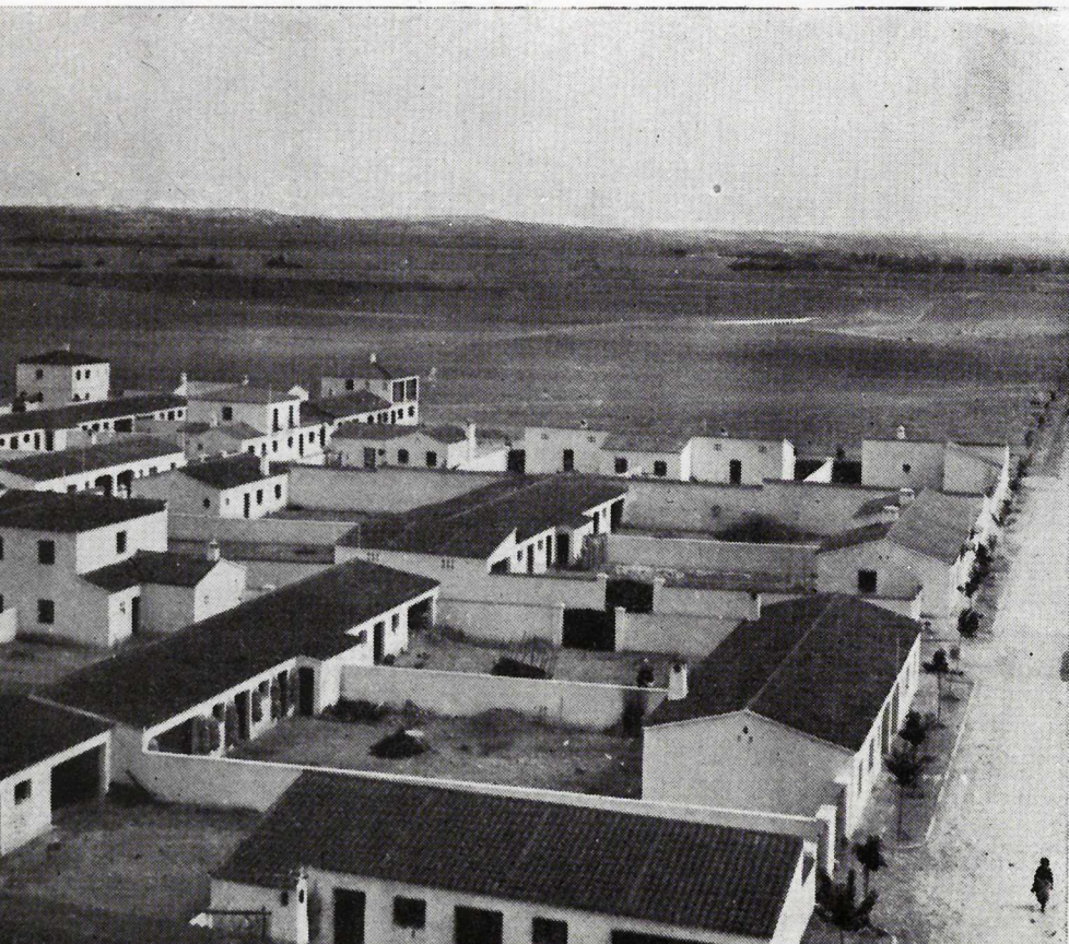
Vegas de Pueblanueva (Toledo).

Las 89 unidades de independencia económica y los 236 huertos se encuentran actualmente adjudicados a igual número de familias de colonos y de obreros, respectivamente.