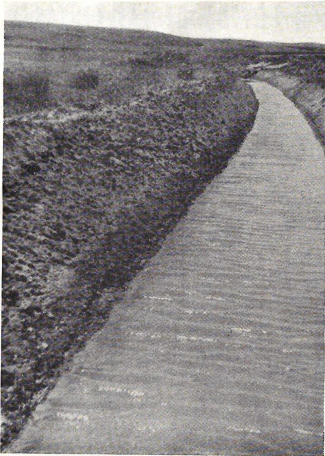
Poveda de las Cintas. Encauzamiento y limpieza del arroyo del Valle.

De las obras de mayor interés para el término de Poveda es la solución al problema del abastecimiento de aguas. Actualmente se obtiene de un pozo artesiano situado en la proximidad de una fuente, siendo su trans-