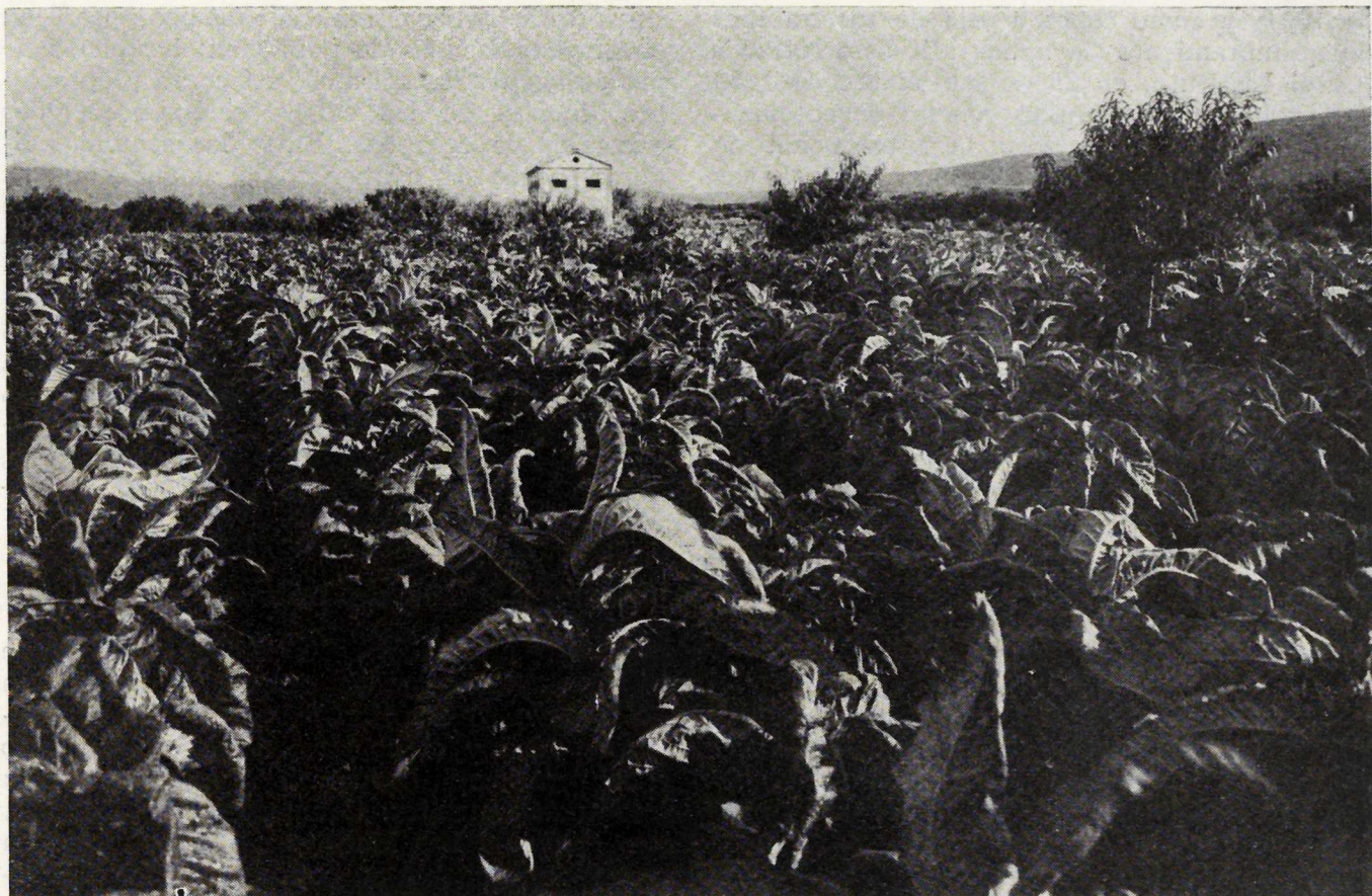
Cultivo de tabaco y secadero establecido por el I. N. C. en Levante.

dose fijado por el Consejo Nacional de Colonización los precios de las tierras excedentes en grandes zonas regables, cuya colonización ha de efectuarse inmediatamente en las zonas regables de Los Monegros, Las Bárdenas, Flumen, Villagonzalo, La Mancha, Bembézar, Lobón, Montijo, Baja del Guadalquivir y Saladares. El total de precios fijados excede de los 100 millones de pesetas.