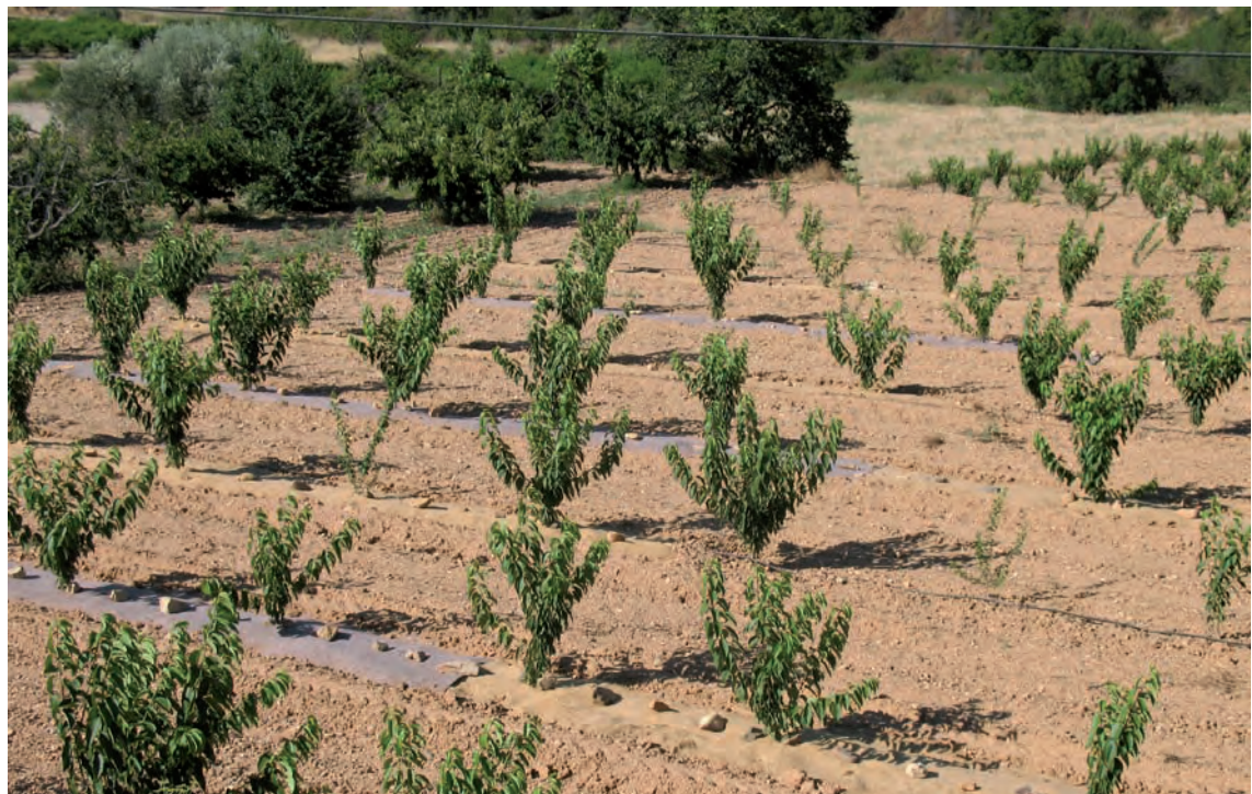
Foto 2. Vista general del ensayo en una plantación de cerezos en Tobed (Zaragoza)

líneas. Esta situación representa a priori una situación muy favorable para estos materiales, ya que el riego localizado evitará un exceso de humedad para las partes enterradas de los acolchados y la reducida vegetación arvense de la parcela limitará la posibilidad de producirse fuertes infestaciones sobre los acolchados. La colocación de los acolchados en ambos lados de la línea fue enterrada y de forma totalmente mecanizada.