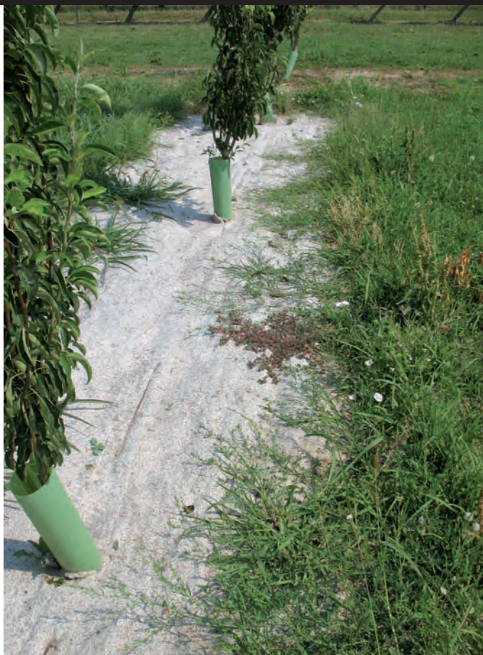
Foto 3. Algunas especies de malas hierbas de porte rastrero que crecen en las calles enherbadas invadieron los acolchados