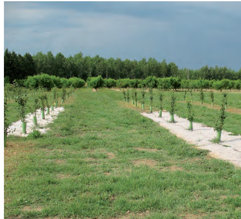
Foto 1. Vista general del ensayo en una plantación de perales en Montañana (Zaragoza)

ello se suelen emplear tubos protectores que se instalan manualmente y que también minimizan los posibles daños causados por roedores. En Producción Ecológica la escarda se suele realizar mediante siega con se-