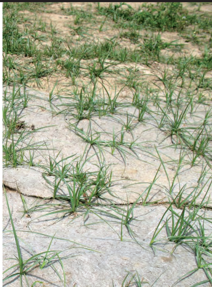
Foto 4. Las malas hierbas Cyperus rotundus y Equisetum spp. fueron capaces de perforar ambos acolchados biodegradables