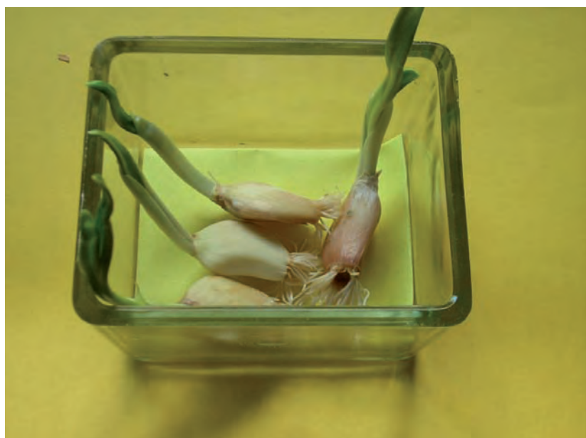
Foto 1. Ajos tratados por termoderapia a 49^{\circ}\text{C}-48^{\circ}\text{C} (1 hora)