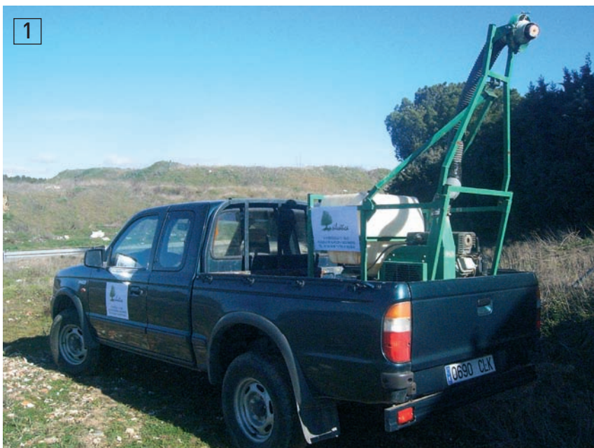
Equipo MICRONAIR AU 8115M montado sobre Pick up Todo Terreno