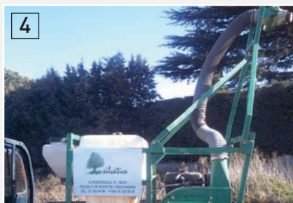
Equipo MICRONAIR AU 8115M montado sobre Pick up Todo Terreno

La capacidad del tanque de un equipo de aplicación MICRONAIR AU 8115 M (Foto 4), montado sobre Pick-up todo terreno es, justamente, de 100 litros. Es decir, con una sola carga, con este equipo se pueden defender 40 hectáreas en un olivar a marco de 7 x 7.