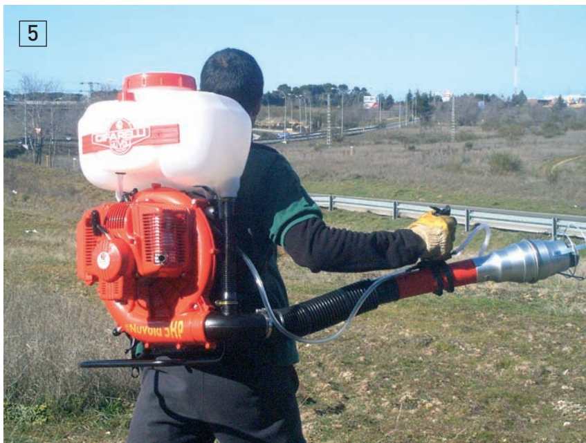
Equipo MICRONAIR AU 8000, de mochila