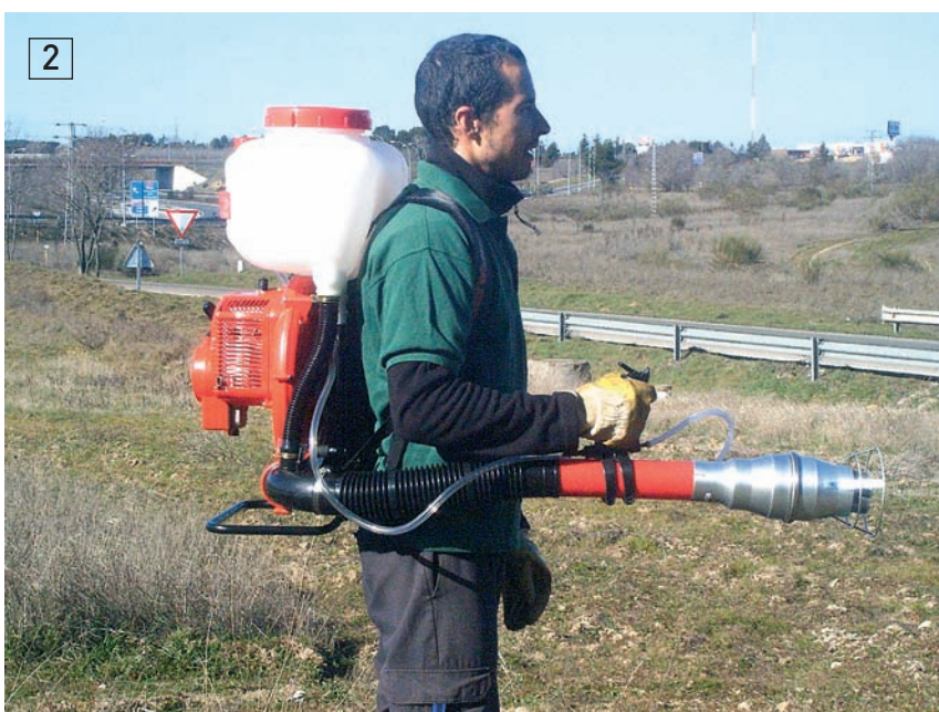
Equipo MICRONAIR AU 8000, de mochila

res a 15 l/ha en aplicaciones terrestres. Esta técnica se basa en el principio de que cuanto más pequeñas sean las gotas, más pequeña es la cantidad de caldo que hay que aplicar para obtener el mismo número de gotas por unidad de superficie foliar, es decir, para obtener el mismo recubrimiento o cobertura.