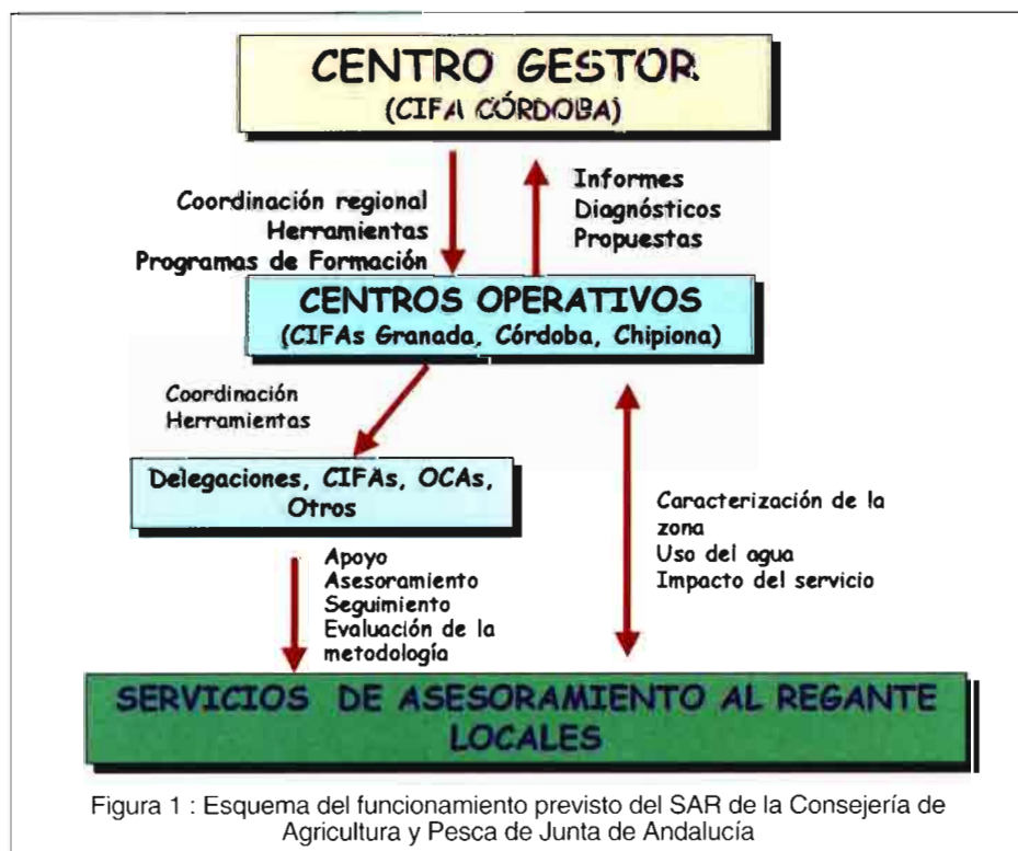
Figura 1 : Esquema del funcionamiento previsto del SAR de la Consejería de Agricultura y Pesca de Junta de Andalucía

UN GRAN ESFUERZO CONJUNTO EN I+D, TRANSFERENCIA, FORMACIÓN Y DIVULGACIÓN