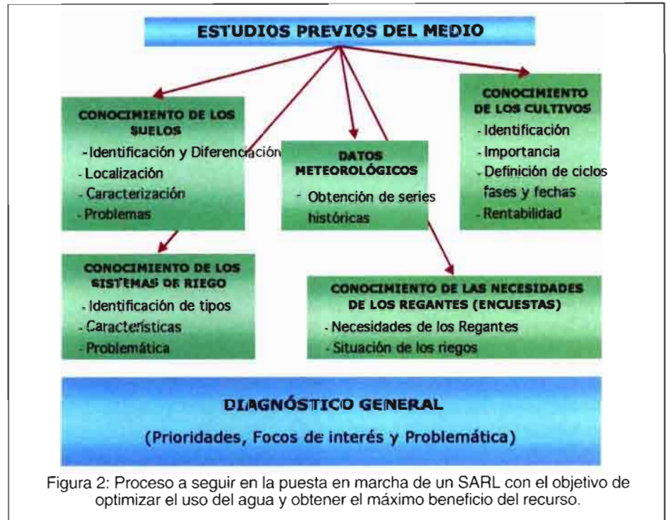
Figura 2: Proceso a seguir en la puesta en marcha de un SARL con el objetivo de optimizar el uso del agua y obtener el máximo beneficio del recurso.

En las primeras fases de la puesta en marcha de un SARL (Figura 2) será necesario conocer en profundidad la situación de la comunidad de regantes y de la zona que se va a asesorar, evaluando, recopilando y generando la información sobre los suelos, la climatología (fundamentales en la programación de los riegos), conocimiento de los cultivos y sistemas