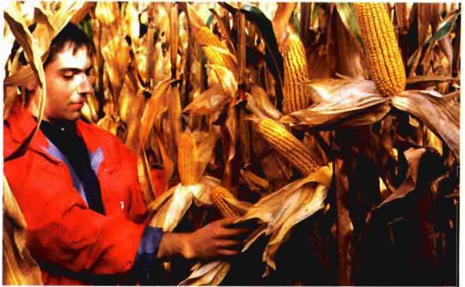
Con maíces genéticamente protegidos contra taladro, se puede conseguir una producción más eficiente y limpia, respetando al medio ambiente

A modo de ejemplo, las asociaciones de agricultores de Canadá, integradas en el Canola Council, publicaron en marzo de 2001 un resumen sobre el impacto de las variedades genéticamente tolerantes a herbicidas sobre los agricultores, la industria y el medio ambiente (Buth y otros, 2001). Con el informe completo disponible en Internet - http://www.canola-council.org/manual/GMO/gmo_mail.htm - este resumen es muy claro; "los agricultores de Canadá han adoptado rápidamente las variedades transgénicas de colza introducidas en 1995... que fueron sembradas en el 55% de los 4,8 millones de hectáreas cultivadas en