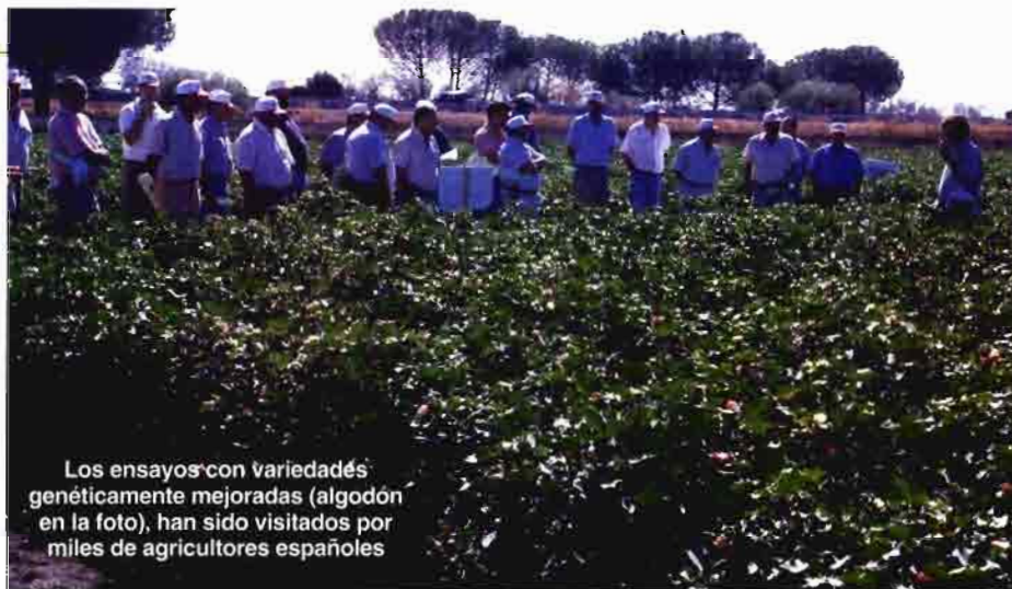
Los ensayos con variedades genéticamente mejoradas (algodón en la foto), han sido visitados por miles de agricultores españoles

Por: Jaime Costa, Alberto Ojembarrena y Esteban Alcalde*.