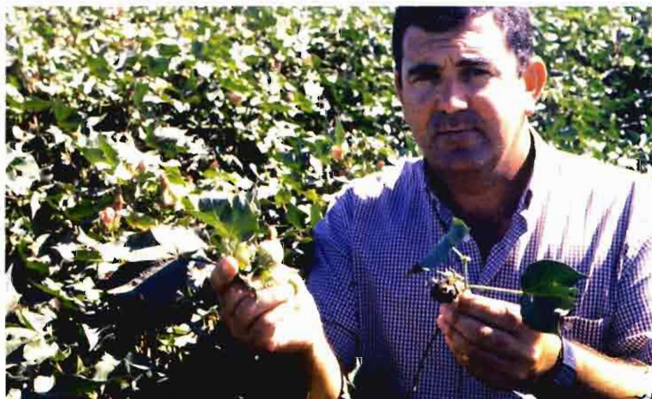
Para evitar daños de orugas en las cápsulas del algodón, la única alternativa a las variedades genéticamente resistentes es seguir usando más insecticidas

afirmar –después de un escrutinio muy superior al realizado con cualquiera de las modificaciones genéticas convencionales-, que las nuevas variedades genéticamente mejoradas son tan seguras como sus versiones convencionales alternativas, con base en: