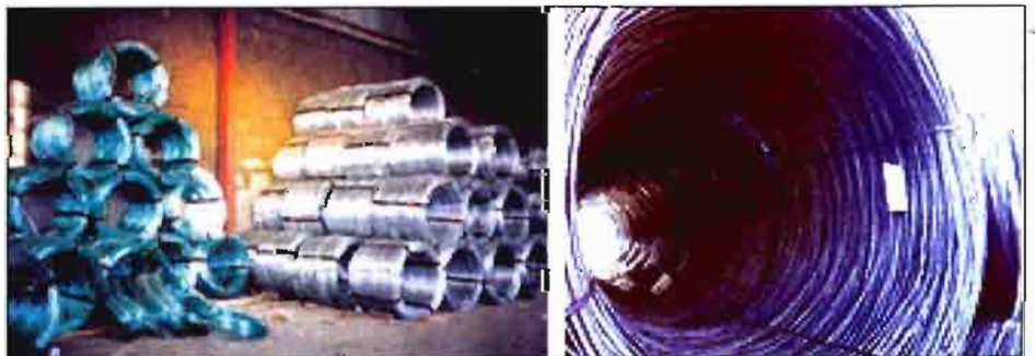
Rollos de alambre galvanizado expuesto para su venta.

La rotura a tracción de las probetas de alambre se ha realizado con una máqui-