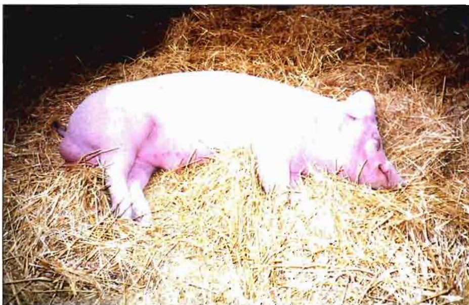
Cuadro 4. Destino de la producción ganadera en Aragón en 1995.

Las ventas de las empresas productoras de elaborados cárnicos en Aragón han aumentado en los dos últimos años. Predominan las empresas de elaborados de carne de cerdo y en concreto los fabricantes de jamón blanco. A pesar de la atomización de este sector, sus ventas han evolucionado positivamente debido, por una parte, a que los elaborados de cerdo aragoneses son de reconocida calidad (comparados con los de