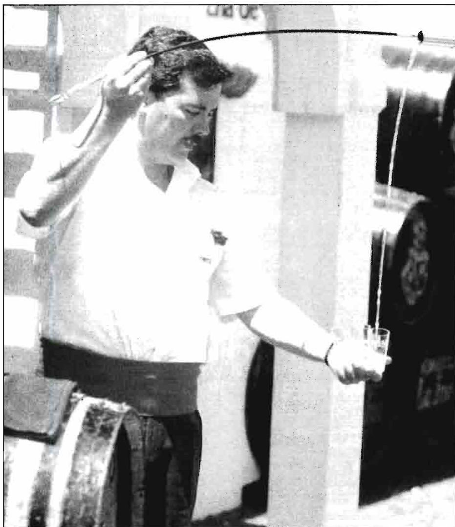
El venenciador representa la figura más internacional de los vinos jerezanos.