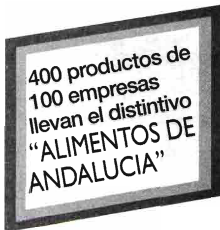
Cuadro nº 1 Denominaciones de origen y específicas en Andalucía

Es interesante hacer una referencia a la protección de denominaciones por parte de la Unión Europea. Los distintivos de calidad para el vino están aprobados en la Organización Común del Mercado (OCM) del vino (Reglamento