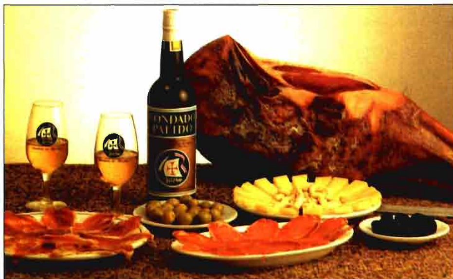
Cuadro nº 2 Inventario de productos tradicionales de la tierra en Andalucía