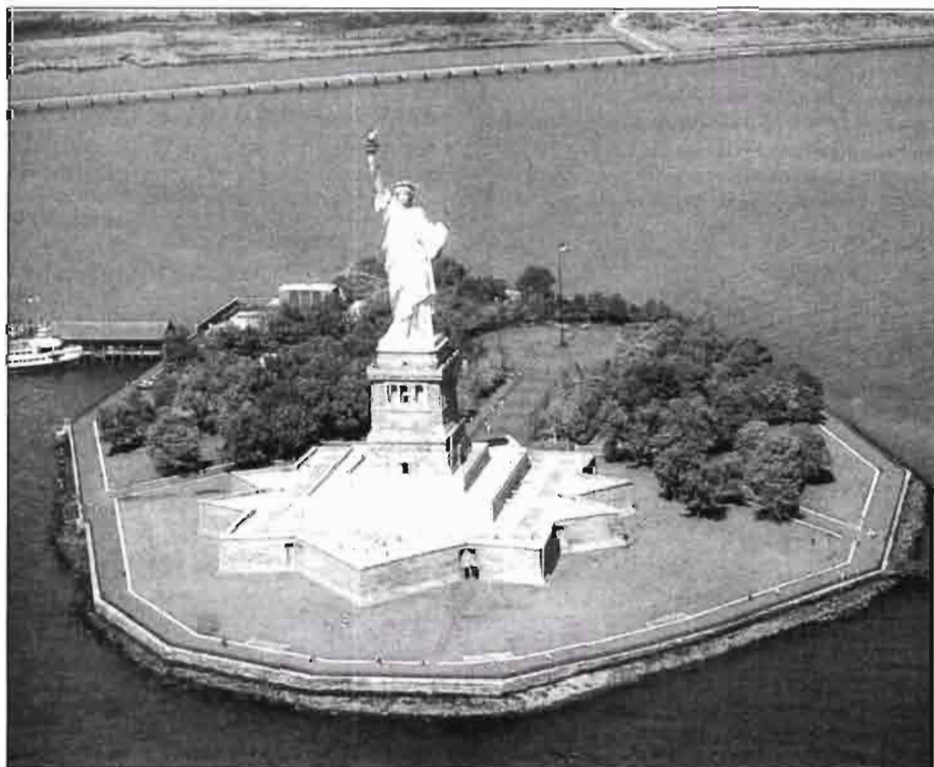
Nueva York. Estatua de la Libertad (EE.UU.)