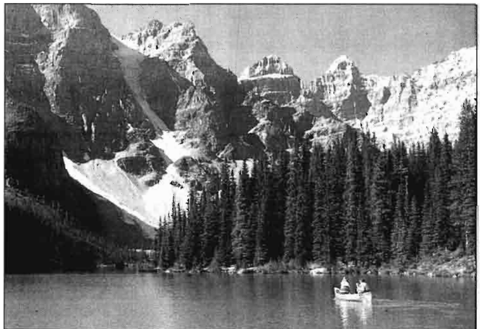
Banff. Lago Moraine (Canadá).