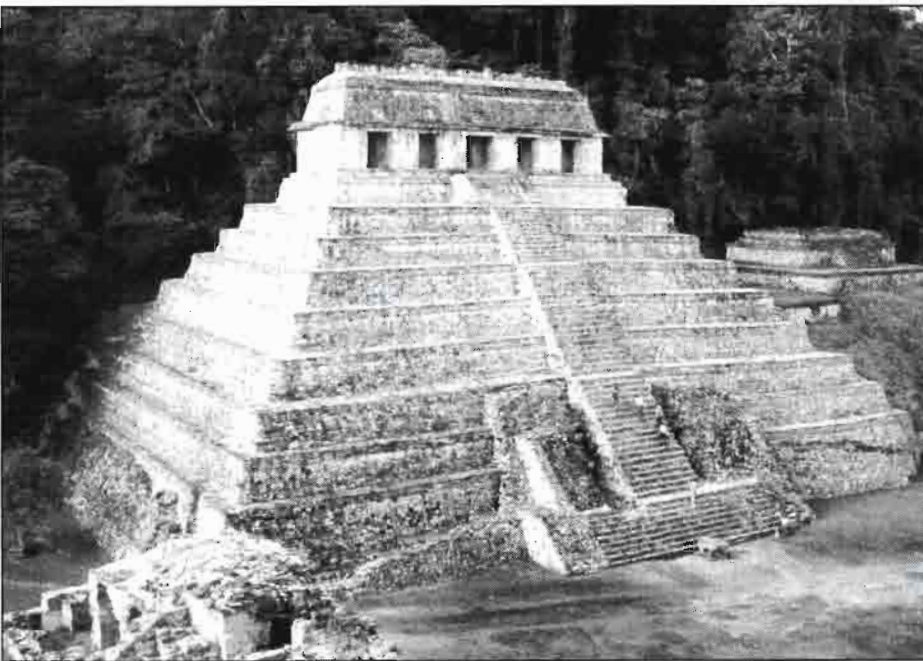
Palenque. Templo de las Inscripciones. (Méjico)