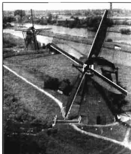
Molinos cerca de Kinderdijk, provincia de Holanda Septentrional.