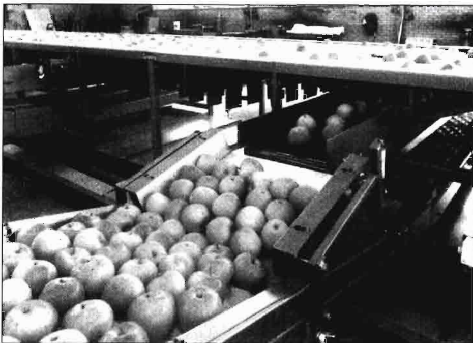
Aproximadamente el 60 por ciento de la producción agrícola holandesa es absorbida por la industria nacional de elaboración de alimentos y la de empaquetado. Este sector es, en cuanto a volumen de ventas, el mayor ramo industrial de los Países Bajos y el segundo en exportaciones.

Las organizaciones interprofesionales holandesas tienen por Ley dos tipos de