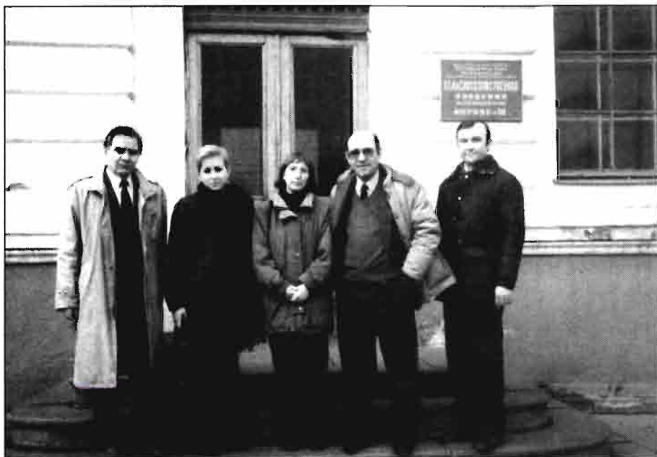
Delante de la Academia de Agricultura de TIMIRYAZEV en Moscú.

geopolítica, recomponiéndose un verdadero mosaico de razas, lenguas, religiones, sistemas económicos, aparece como un gigante con los pies de barro, que empieza a cuartearse y hay una disputa ó indiferencia (en el mejor de los casos) para ver donde caen los pedazos.