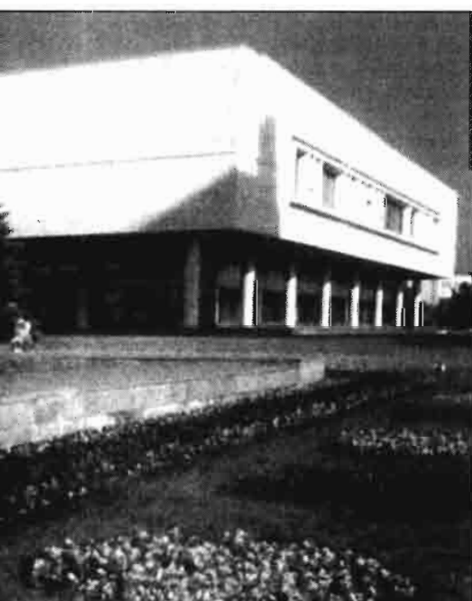
CUADRO N° 12 IMPORTACIONES DE PRODUCTOS AGRICOLAS (millones de dólares) (1)