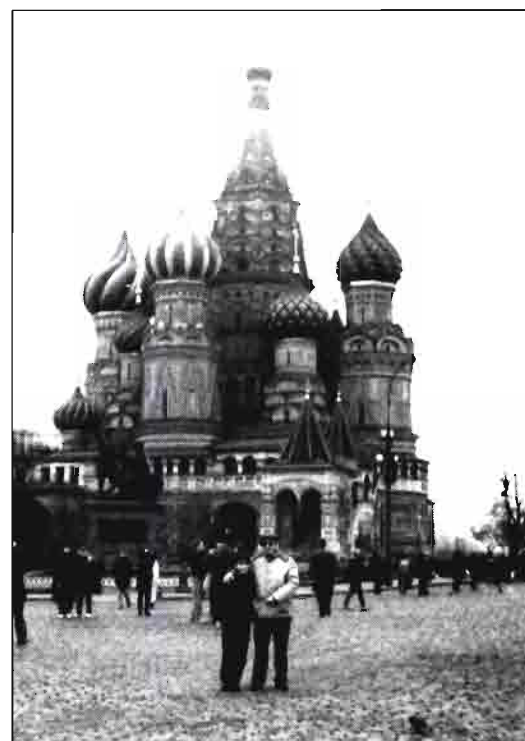
La Plaza Roja de Moscú.

De una parte aumentarán los rendimientos en el campo, disminuirán las pérdidas en el transporte y almacena-