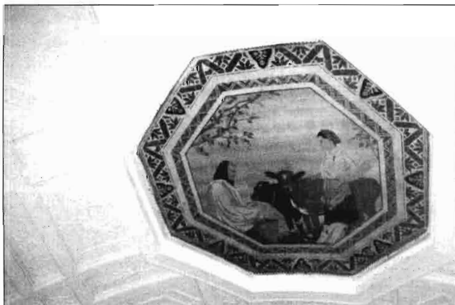
Mosaico en el techo del metro de Moscú, ilustrando la ganadería.

Fuente: "La URSS en cifras para 1988"; USDA: "USSR Agriculture and Trade report".