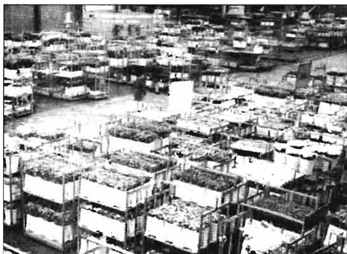
Luego de su venta, las flores son distribuidas en los carros de los compradores. En la sala de distribución hay muchas personas dedicadas a esta tarea.