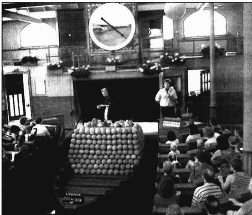
Subasta de verdura, Broek-op--Landedijk, Países Bajos

regularmente para deliberar con la dirección de la VBA sobre asuntos importantes que están a la orden en toda la asociación. Para la ejecución de esa política y la gerencia diaria se ha nombrado a un equipo directivo, bajo la dirección de un director general. La gerencia ha sido dividida en cuatro secciones cuya tarea principal se centra en los procesos empresariales primarios, (Transacción y Formación de Precios, Logística, Automatización y Desarrollo de Productos y Mercados). Además existen cuatro departamentos de apoyo (Financias y Administración, Personal y Organización, Servicios Staff y Servicios de Secciones). La dirección y el equipo directivo mantienen naturalmente estrechos contactos con la administración. Hay cinco salas de subasta (cuatro para las flores de ramo y una para las plantas interiores y de jardín), cada una de ellas con su propia sala de abastecimientos, espera y distribución. Además de los relojes como instrumentos de formación de precios, existe también la Oficina Interventora de la VBA, que se dedica a la negociación de partidas grandes y uniformes de plantas de interior y de jardín. Los compradores y vendedores se ponen en contacto mutuo a través de indispensable para la formación de precios. además de las secciones principales antes mencionadas, la VBA tiene suficientes servicios de apoyo, como son, control de calidad, contacto con los cultivadores e información, telecomunicación, etc. La VBA da