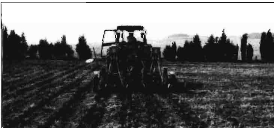
El "no laboreo" que ahorra tiempo y dinero, se impone en algunos cultivos navarros. Siembra directa con sembradora monograno

La segunda edición del Catálogo de software para la Agricultura (6) coeditado por el Ministerio de Agricultura, Pesca y Alimentación y La Fundación para el Desarrollo Social de las Comunicaciones (FUNDESCO) es una buena información de partida para hacer un estudio de las caracte-