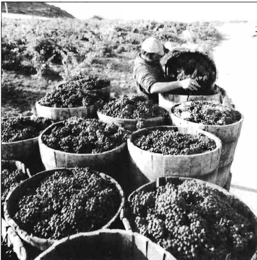
La uva tinta de Logroño, materia prima para la calidad de los vinos de La Rioja.

— Los fiambres crecen un 8% anual que parece que se mantendrá. Los productos en lonchas y en sobres son los que más crecen, del orden del 15 al 20% anual.