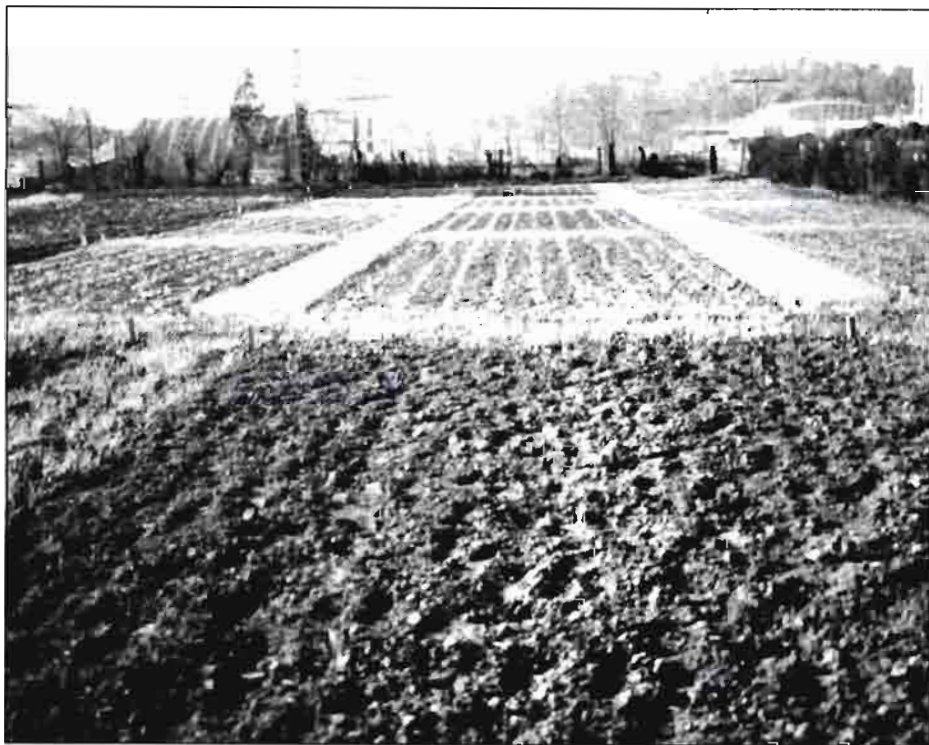
Figura 1. El diseño de los experimentos en campo, para los estudios epidemiológicos, ha sido hecho teniendo en cuenta la posible influencia de unas parcelas sobre otras. Para impedir dicho accidente se construyeron bandas densas de triticale entre parcelas elementales.

(*) Servicio de Investigación Agraria. Junta de Extremadura. Apartado 22. 06080 BADAJOZ.