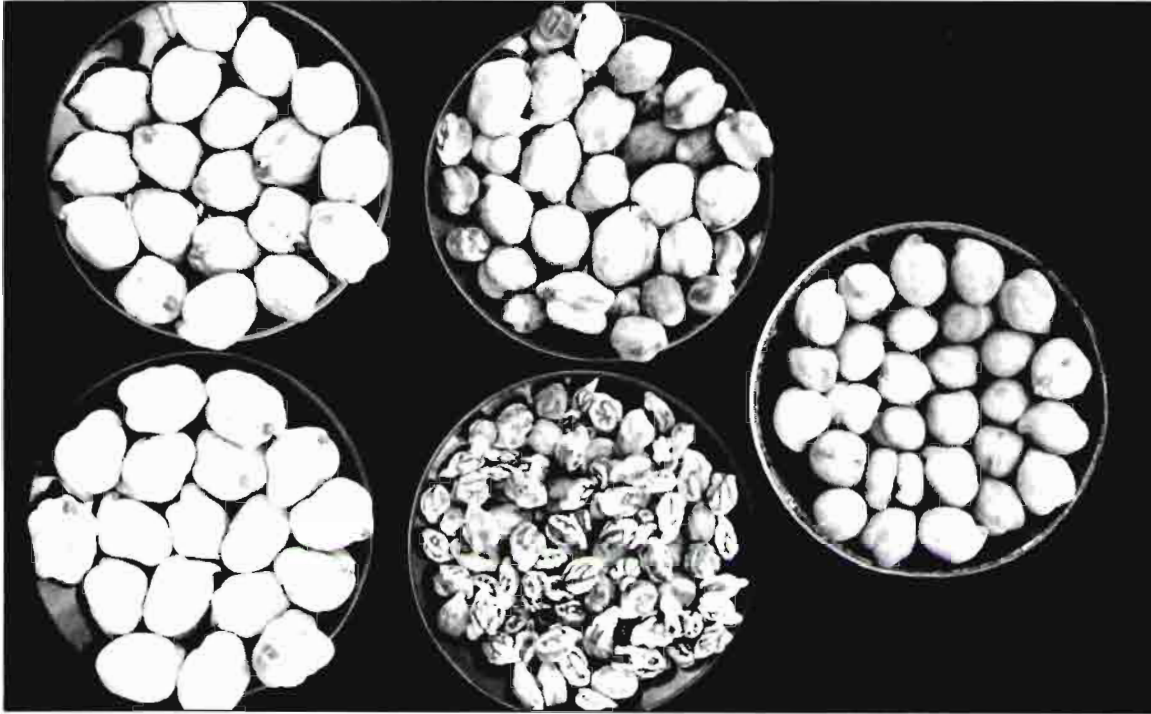
Figura 3. Las muestras de los dos primeros garbanzos de la izquierda (Blanco Lechoso y Castellano), obtenidos siguiendo las recomendaciones sanitarias propuestas para impedir la Rabia, contrastan con sus homólogos afectados por la enfermedad. El último de la derecha corresponde a un cultivar resistente al patógeno y producido sin profilaxis ni terapéutica alguna para prevención de la Rabia.

una era la determinación del papel real que, en la vehiculación de la Rabia, tenían los rastrojos de cosechas atacadas; otra cuestión era conocer la capacidad de extenderse la enfermedad a partir de los primeros focos detectados y sobre un cultivar (Castellano) considerado como tolerante a la Rabia. Mediante diversos experimentos, analizados estadísticamente, hemos podido conocer que los rastrojos de cosechas atacadas son extraordinariamente peligrosos en la vehiculación de la enfermedad al año siguiente; también hemos comprobado que la extensión de la Rabia sobre un cultivar tolerante, en condiciones de una primavera normal en Extremadura, a partir de focos primarios, es muy lenta, careciendo de importancia respecto a la producción normal esperada.