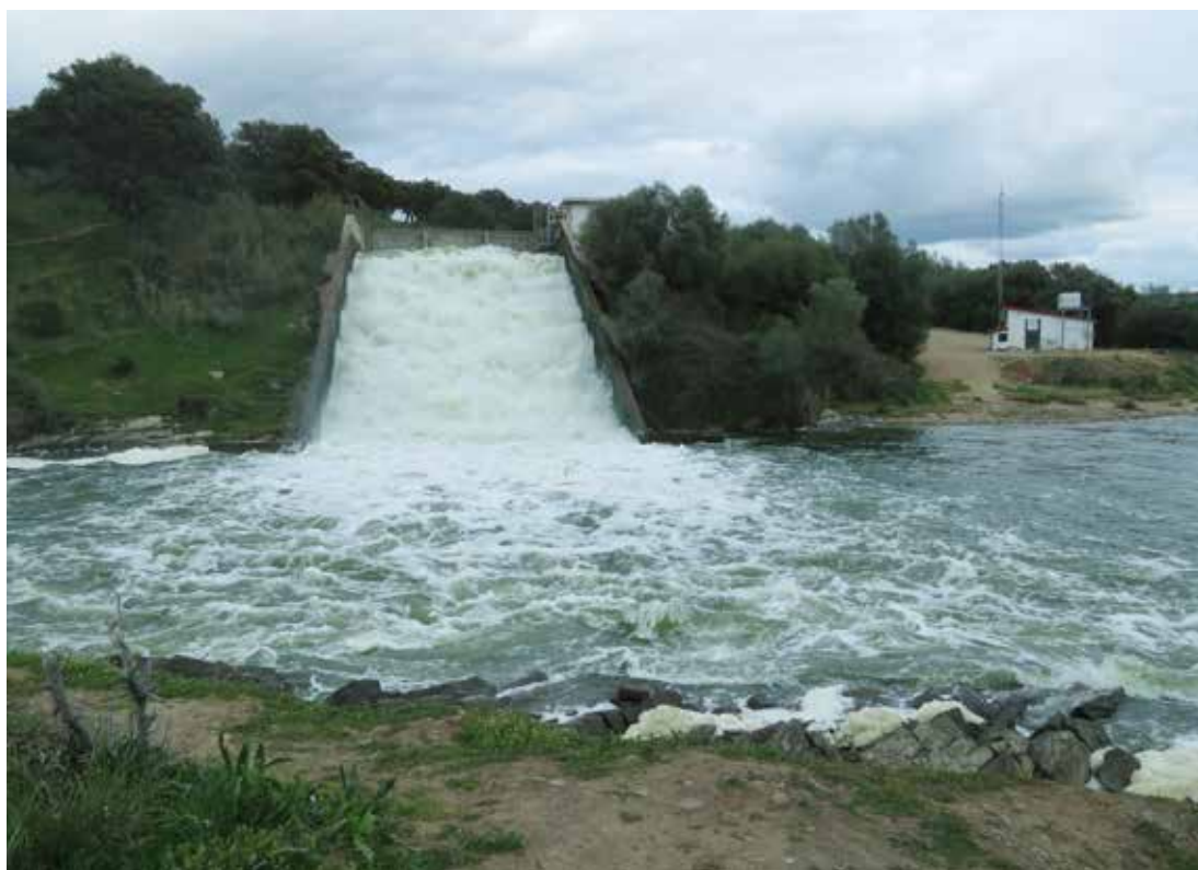
Impacto por vertido térmico. Aliviadero del embalse de Arrocampo (Serrejón, Cáceres), parte del sistema de refrigeración de la central nuclear de Almaraz, vertiendo a la masa de agua Torrejón Tajo, muy modificada (embalse) y con potencial ecológico deficiente.

o potencial, es necesario realizar una verdadera evaluación técnico-científica, que analice en profundidad los efectos del proyecto sobre todos y cada uno de los elementos de calidad que definen el estado o potencial de la masa de agua originaria, y que concluya de forma motivada y sólidamente fundamentada sobre si se producirá o no algún deterioro, o si se impedirá o no alcanzar el buen estado o potencial.