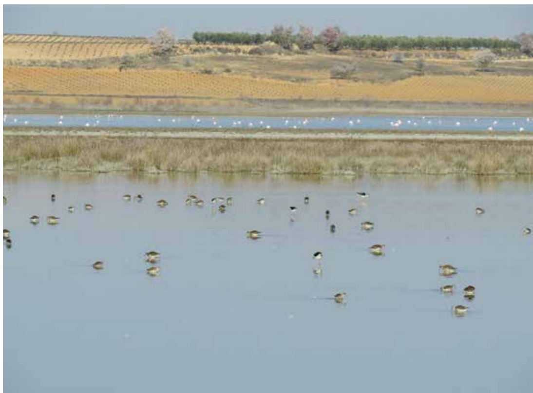
En ocasiones una presión puede generar una oportunidad. Laguna de Manjavacas (Mota del Cuervo, Cuenca), Reserva Natural, ZEC y ZEPA, crónicamente desconectada del sobreexplotado acuífero Mancha Occidental, pero recibiendo el vertido de la EDAR de Mota del Cuervo, actualmente en ampliación.

proyectos. Recordemos que dicho artículo 4(7) ha sido traspuesto por el artículo 39 del Reglamento de la Planificación Hidrológica y artículo 2 del Real Decreto 1/2016, y que su consideración para la planificación hidrológica del actual ciclo ya ha sido objeto de una Instrucción de la Dirección General del Agua de 19 de agosto de 2015. Las características de este singular procedimiento han sido recientemente perfiladas por la Comisión Europea mediante su Documento Guía ° 36 “Excepciones a los objetivos ambientales de acuerdo con el artículo 4(7)” 1 , dentro de la estrategia común de aplicación de la Directiva Marco del Agua en el conjunto de los estados miembros.