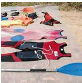
Figura 5. Los elementos más contaminados fueron los trajes de neopreno y los chalecos.