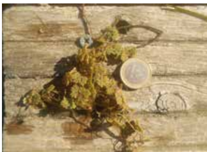
Azolla ( Azolla filiculoides )