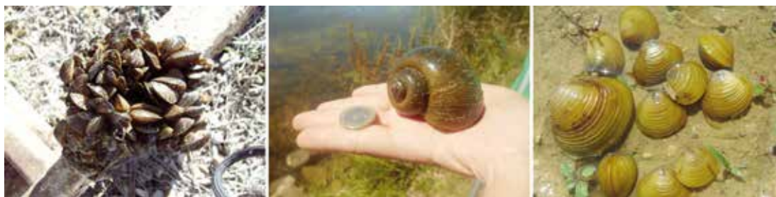
Mejillón cebra ( Dreissena polymorpha )