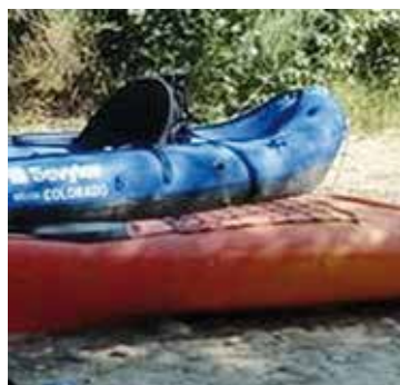
Figura 4. Equipación asociada a la práctica del piragüismo objeto de análisis.

Si bien se desconoce el número de larvas que es necesario introducir en una masa de agua libre de la especie para que una nueva población se