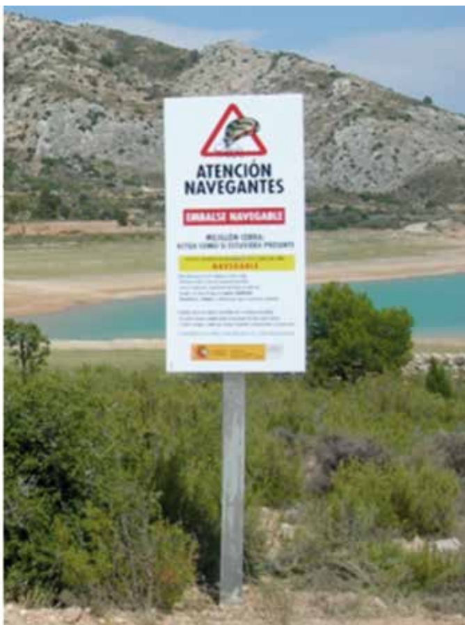
Figura 7. Cuento de educación primaria, folleto divulgativo sobre EEI de aguas continentales, carteles informativos en campo.