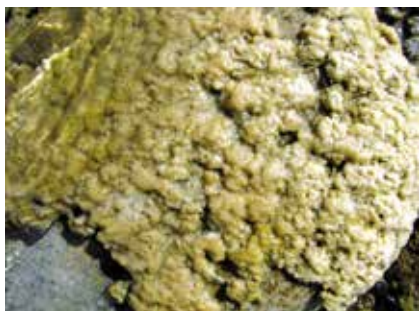
Moco de roca ( Didymosphenia geminata )