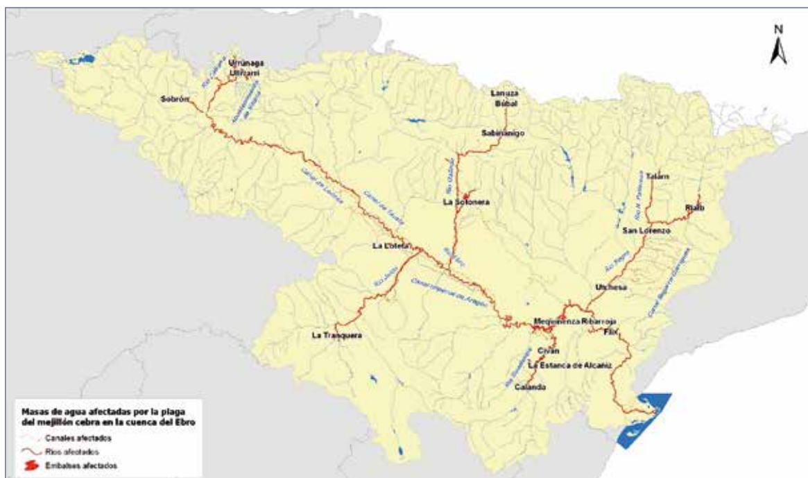
Figura 3. Mapa de presencia de mejillón cebra en la cuenca del Ebro (octubre 2014).

medio ambiente, estableciendo el régimen jurídico básico de la conservación, uso sostenible, mejora y restauración del patrimonio natural y de la biodiversidad, como parte del deber de conservar y del derecho a disfrutar de un medio ambiente adecuado para el desarrollo de la persona.