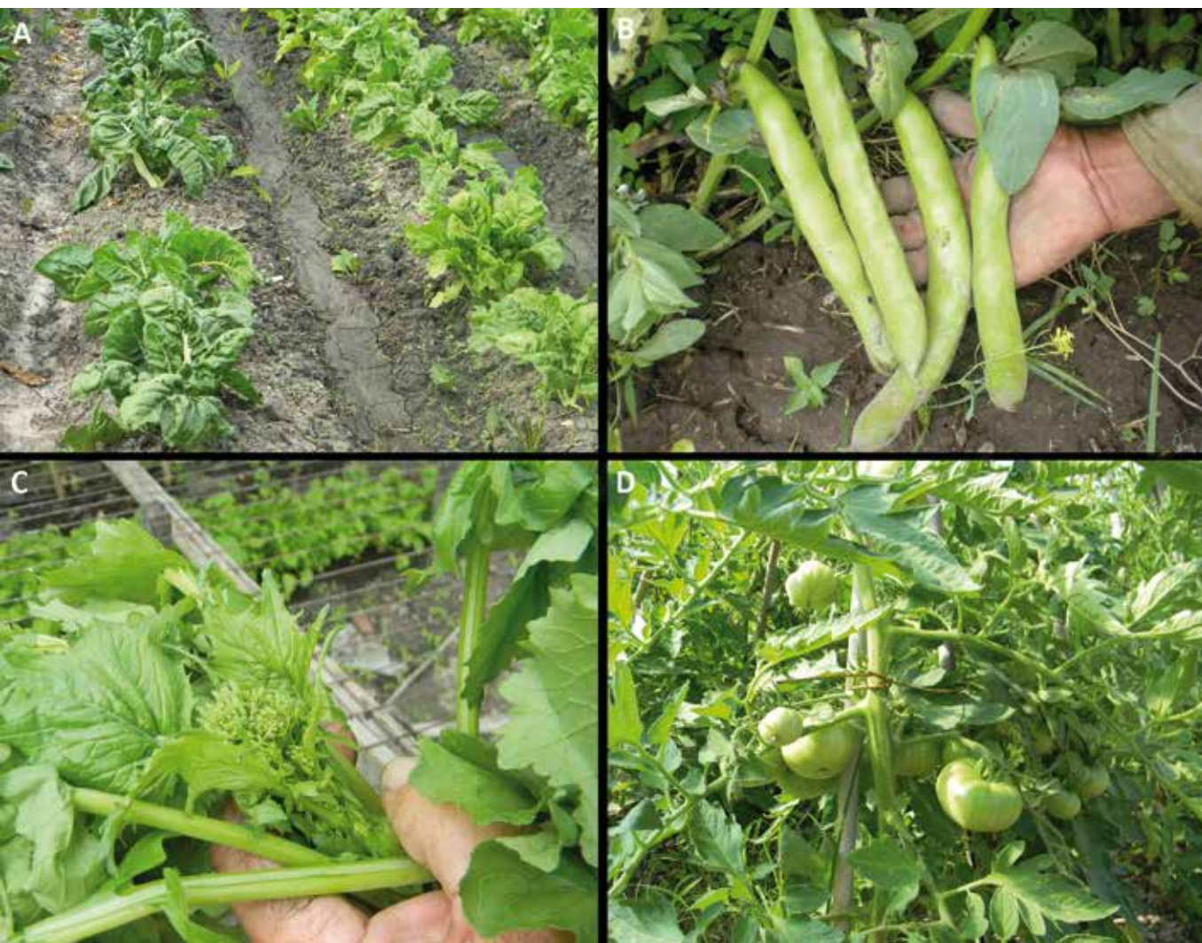
Fig. 7. Cultivares comerciales en el cinturón hortícola. A. Beta vulgaris var. cicla , “acelga” (a la izquierda, ‘Acelga de penca blanca’; a la derecha, ‘Acelga de penca verde’, considerada una variedad típica de la zona. B. Vicia faba , “haba”. C. Brassica napus ‘Grilo’. D. Solanum lycopersicum ‘Tomate platense’, variedad típica de la zona y conservada por su excelente sabor, a pesar de su escasa demanda en el mercado, por su forma variable y su rápida maduración.

genético con otras zonas productivas del país. Tanto para huertos familiares como comerciales, la horticultura constituye una instancia de diversificación biocultural.