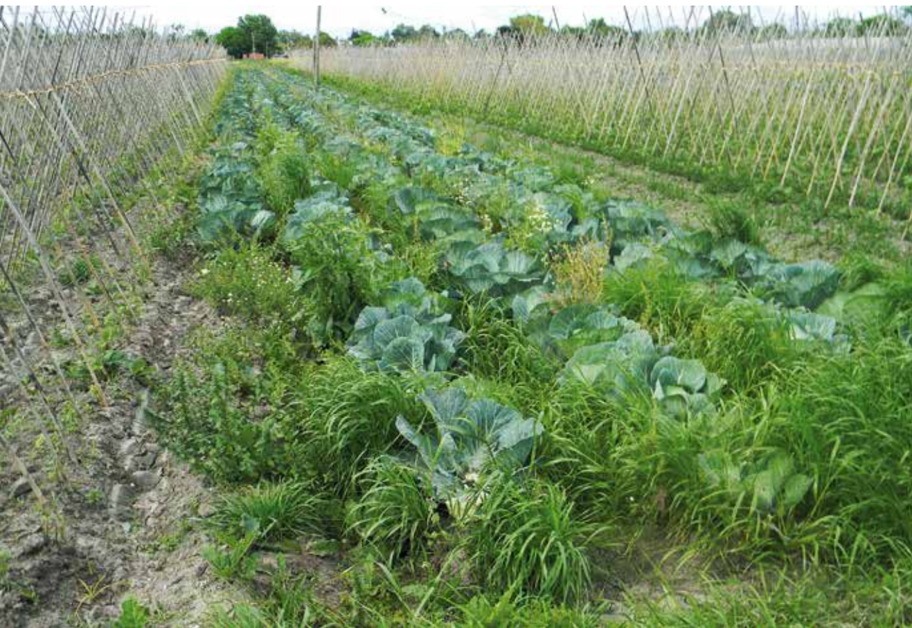
Fig. 4. Huerto comercial del cinturón hortícola platense, con “repollo” ( Brassica oleracea L. var. capitata L.) para cosechar.

tad innovadora. Al reconocer como diferentes ciertas plantas o grupo de plantas, se segregan características que son objeto de selección cultural, y terminan por establecerse como cultivares propios del área (Del Río et al. , 2007), lo que incrementa la agrobiodiversidad local.