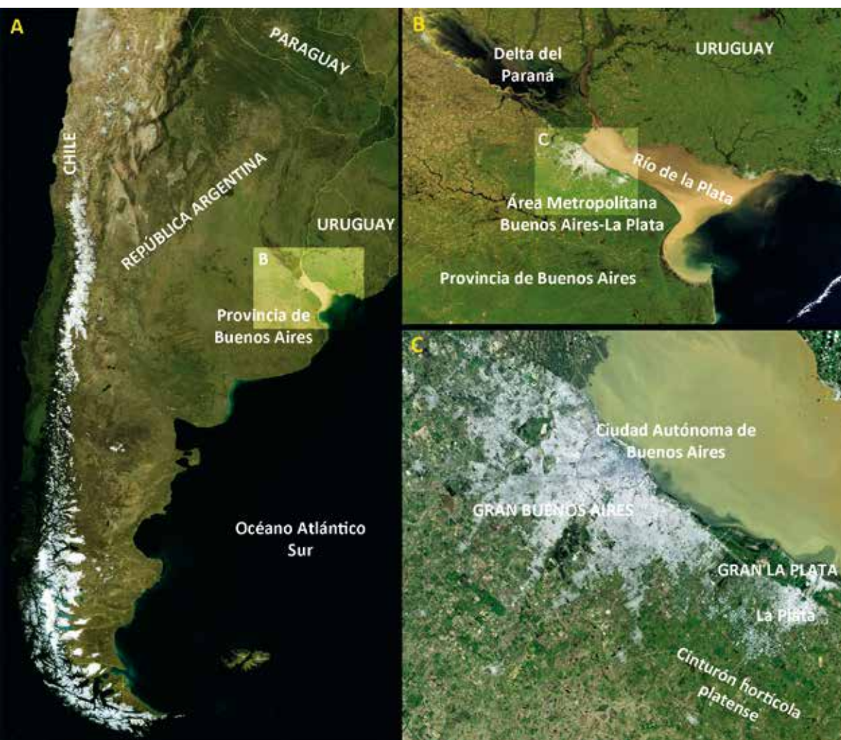
Fig. 1. A. La Argentina, y ubicación de la región del río de La Plata. B. La región rioplatense y localización del Área Metropolitana Buenos Aires-La Plata. C. Ubicación del cinturón hortícola platense.

El Gran La Plata es una aglomeración urbana desarrollada en torno a la ciudad de La Plata, la capital de la Provincia de Buenos Aires, que comprende los partidos de La Plata, Ensenada y Berisso (Fig. 1). Junto a la aglomeración urbana contigua del Gran Buenos Aires, surgida en torno de la Ciudad Autónoma de Buenos Aires, la capital del país, conforman el área metropolitana de mayor extensión y población de la Argentina: según el censo nacional del año 2010, el Gran La Plata contaba con 800 000