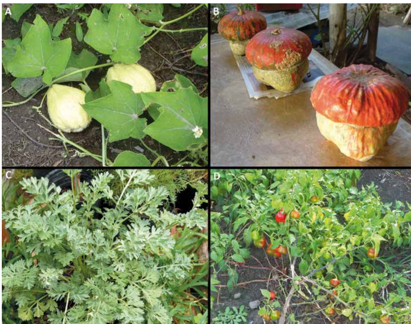
Fig. 8. Cultivares ligados a tradiciones en huertos familiares. A. Secchium edule , “papa del aire”, se cultiva por tradición familiar; en uno huerto, al menos, por tres generaciones. B. Cucurbita maxima subsp. maxima ‘Zapallo hongo’, igual caso que el anterior. C. Artemisia absinthium , “ajenjo”, con uso medicinal. D. Capsicum baccatum var. pendulum ‘Campanita’, su cultivo también responde a tradiciones familiares locales, en algunos de los huertos relevados.

dad, también las que la incrementan), ajustan el conocimiento que las originó a las nuevas circunstancias (en esto reside su valor adaptativo). Así, la recursividad entre conocimientos y prácticas hace posible la evolución del sistema hortícola local, en su compleja dimensión biocultural.