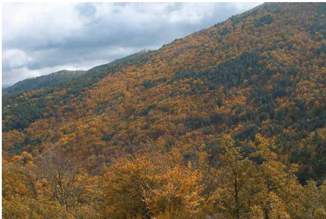
Hayedo de Tejera Negra desde Matarredonda.

húmedos de hoja ancha. Ante los escenarios de cambio climático planteados, los modelos prevén su progresiva sustitución a lo largo del siglo XXI por bosques de P. sylvestris , cuyos requerimientos hídricos son algo menores. Esto indica que la pérdida de especies Eurosiberianas, Boreales y Boreoalpinas, hoy rodeadas de vegetación mediterránea y refugiadas en la media y alta montaña de estos macizos desde el periodo Tardiglaciario, será claramente asimétrica en sentido SW-NE: mayor en los macizos surorientales del Sistema Central (Sierra de Francia, Gredos, Bejar y Malagón) y menor en el Sistema Central oriental (Sierra de Guadarrama y Sierra de Ayllón) y en la Ibérica norte (La Demanda, Urbión). El hecho se debe probablemente a que la parte oriental de la sierra de Guadarrama y Somosierra-Ayllón, en el Sistema Central, tienen (como el Moncayo, Urbión o la Demanda, ya en el Sistema Ibérico) una precipitación estival sensiblemente mayor que Gredos por su latitud y su posición geográfica, con acceso a las zonas de bajas presiones inducidas en el cuadrante nororiental de la península durante el semestre cálido del año (10) . Por el contrario, la Sierra de Gredos, con un carácter mediterrá-