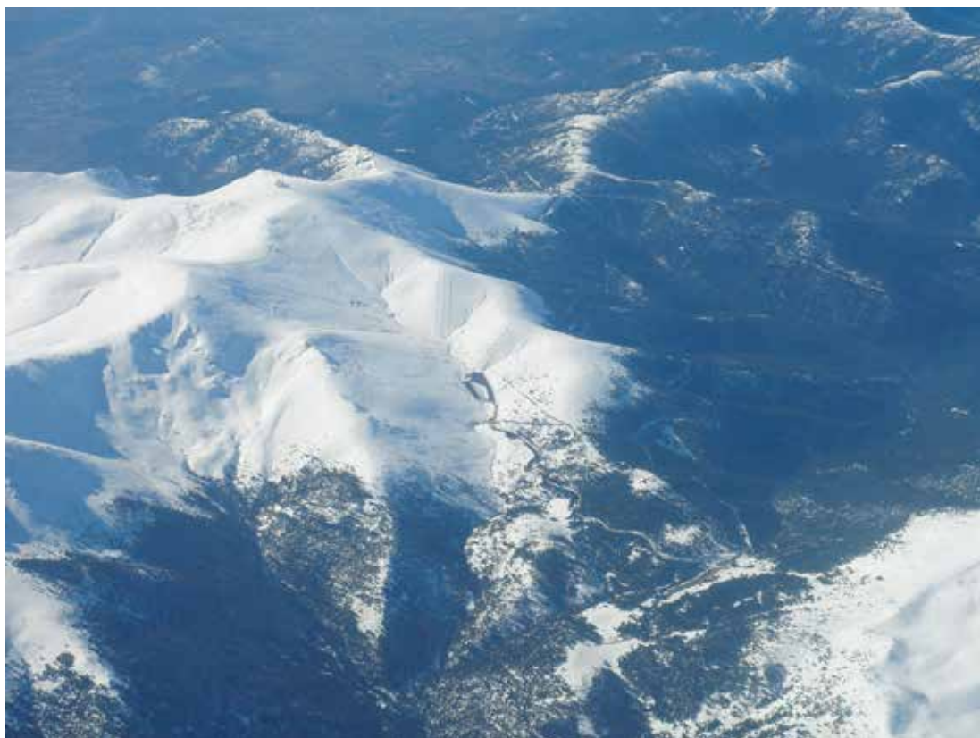
Instalaciones deportivas en la alta montaña de Guadarrama. Valdesquí.

el mundo rural y muchos naturalistas cambios en las áreas de distribución de especies debidos a grandes proyectos de repoblación, introducción de especies exóticas, descuido ganadero de los pastos y otros cambios de uso del suelo que han hecho desaparecer buena parte de la heterogeneidad y complejidad de paisaje rural cultural. Se trata de cambios ocurridos en el Guadarrama en los últimos cincuenta años. Algunos expertos piensan que tales transformaciones han disminuido la capacidad de respuesta de las especies y la función amortiguadora de la diversidad biológica ante el cambio climático. Las políticas de gestión en el marco derivado de estas circunstancias no parecen contar por el momento con estrategias de mitigación y adaptación. El problema biológico no es el cambio en sí –fenómenos ecológicos de cambio físico y biológico han caracterizado a la ecosfera a lo largo de su larga historia– sino probablemente la velocidad a la que se está produciendo. La circunstancia merece, además, una perspectiva sociocultural con referencias geológicas –los 20 000 años transcurridos entre la última ‘fase fría’ y la posterior ‘fase cálida’ del