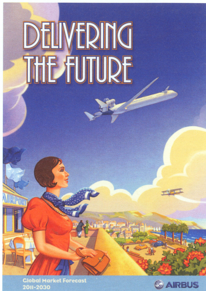
Figura 1. Portada de la última edición del Global Market Forecast de Airbus (año 2011)

las investigaciones realizadas desde la perspectiva del ciclo de vida completo indican que dichas premisas no se cumplen.