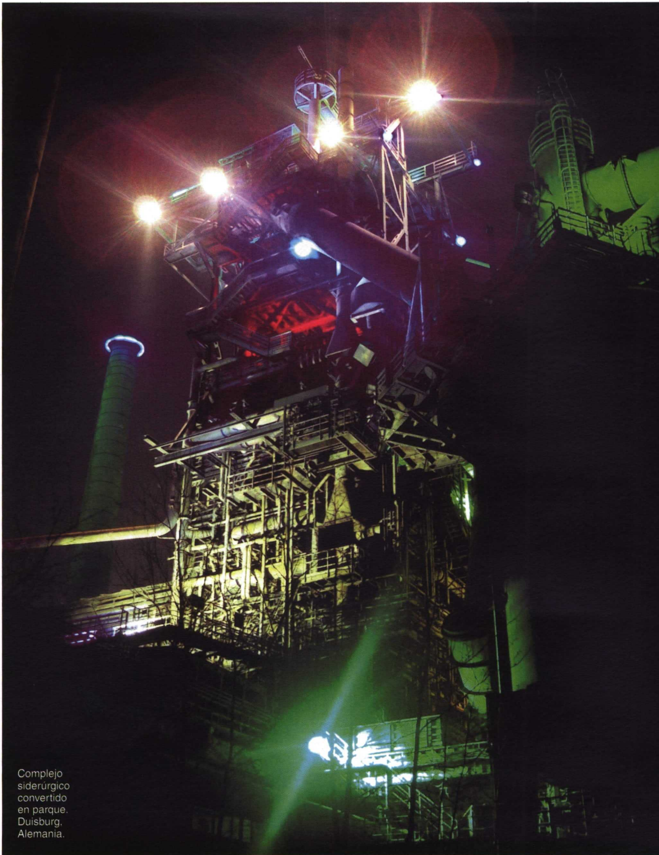
Complejo siderúrgico convertido en parque. Duisburg, Alemania.