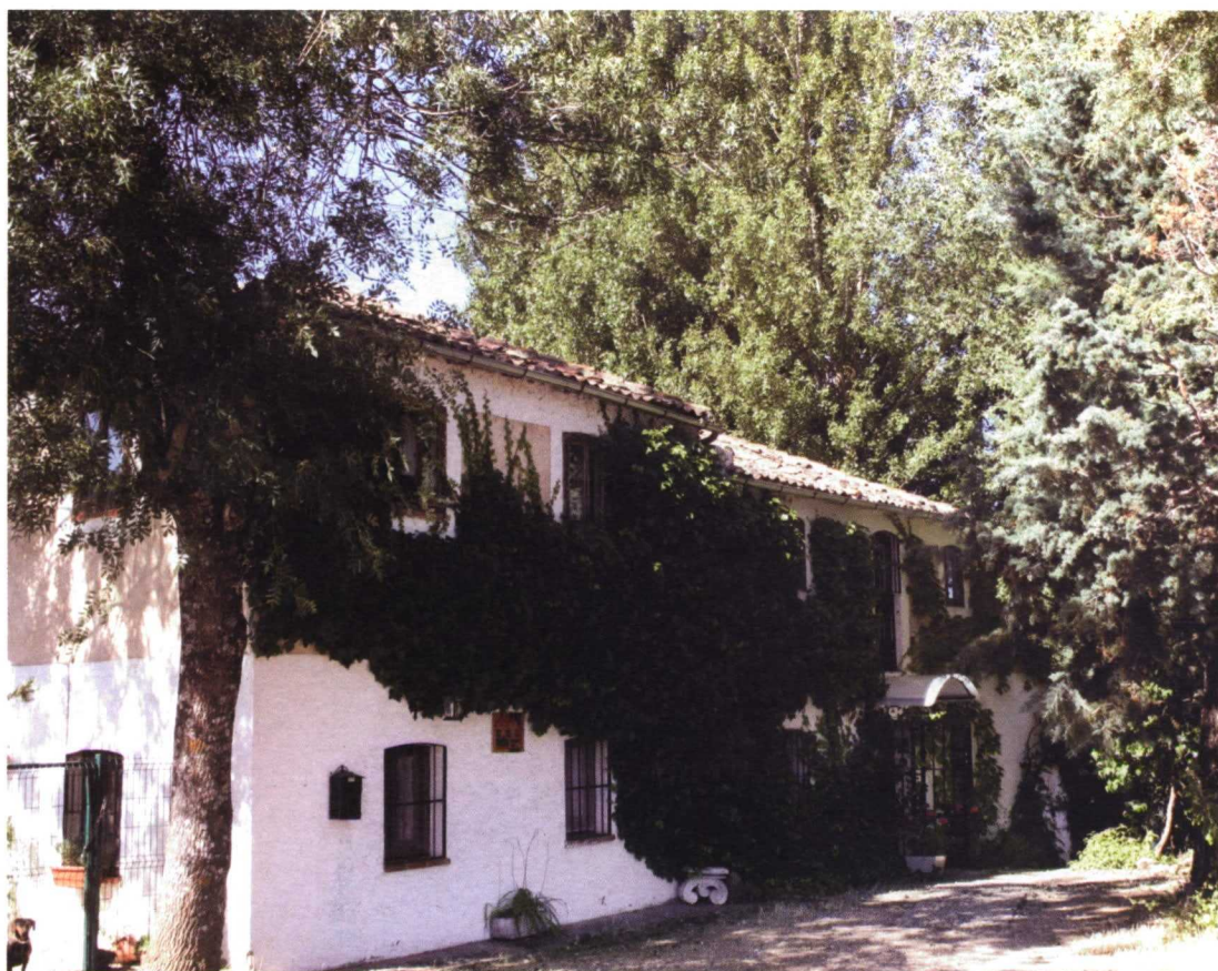
Reconversión de un molino en hotel rural. Molino del Río Viejo, Collado Hermoso, Segovia.

lugar a la generación de residuos, posibilidad esta que, paradójicamente, se encuentra a nuestro alcance (¡!), como veremos en los siguientes casos de estudio.