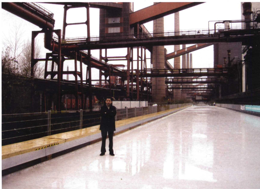
Pista de patinaje junto a la Fábrica de Coque de Zollverein, Essen, Alemania.

rurales. Una vez más, la generación de valor ha venido de la mano de la singularidad en la forma de alojamiento que se ofrece: la posibilidad de dormir en un molino, por ejemplo. Las distintas experiencias de alojamiento temporal en instalaciones inicialmente concebidas con otro uso, tales como molinos, graneros o, incluso, minas, han traído como consecuencia la creación de un innovador y exitoso concepto para nuestra potente y madura industria turística, cuyos productos clásicos, sol y playa, se encontraban en vías de agotamiento. El nacimiento del turismo industrial, específicamente orientando a nuevos sectores y complementado con actividades relacionadas con la cultura y la naturaleza configura ya una realidad de productos alternativos para nuestro sector turístico. Una realidad que, además de crear vías de crecimiento económico de alto valor añadido, fomenta un crecimiento sostenible, tanto desde el punto de vista constructivo, como desde una óptica cultural, pues el mantenimiento de estas construcciones conserva la memoria de los lugares y permite la comprensión de su historia, la no destrucción, tan escasa por estos lares desgraciadamente.