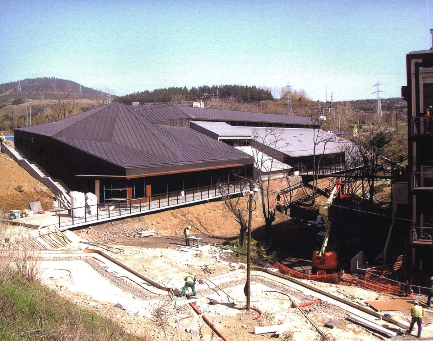
Estado actual del Muelle de Carbones, en construcción.

ción de valor pues, amén de su capacidad para la creación de singularidades atractivas y el mantenimiento de la conciencia histórica de los lugares, no exige, en muchos casos, una movilización de recursos importante. Si, además de contribuir a la creación de riqueza, se consumen pocos recursos materiales, energéticos e, incluso, económicos, cabe preguntarse la causa por la que este tipo de actuaciones aún se encuentra en pañales.