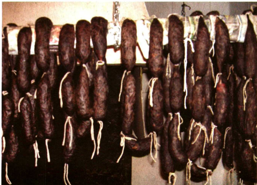
Uno de los embutidos más populares: las morcillas, secándose al calor de la lumbre.

Hace poco, caminando por el campo de Montiel, Ramón, en el Ojuelo, muy cerca del nacimiento del Guadiana, nos contó una anécdota