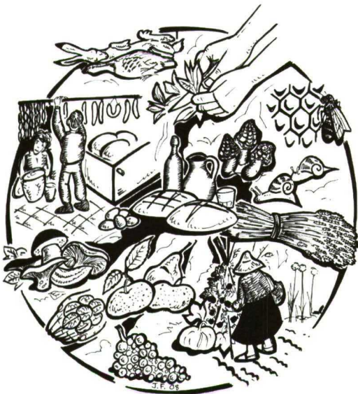
Ciclo anual de los alimentos tradicionales. Dibujo: J. Fajardo.

cados en el Creciente Fértil, cereales, legumbres, frutas... que forman parte desde entonces de nuestra dieta. La ganadería nos trajo el uso de la leche, el queso y la carne de animales domésticos. Desde los centros de origen asiáticos, poco a poco, se fueron incorporando nuevos alimentos, con un gran impulso a partir de la llegada de los árabes a la península que introdujeron con fuerza muchos de aquellos productos. Tras la reconquista, se impuso el consumo de carne de cerdo y vino. El descubrimiento de América supuso un cambio radical en nuestra alimentación. Productos tan habituales hoy como tomates, pimientos, calabazas o patatas se añadieron a nuestra dieta, en detrimento de otros anteriores como los humildes nabos, desplazados por las patatas. En la actualidad, las redes internacionales de distribución de alimentos permiten que podamos utilizar en nuestra cocina alimentos producidos en regiones lejanas del mundo, casi en cualquier época del año, de manera que, en apariencia, se ha diversificado extraordinariamente la alimentación, aunque en la práctica, se ha simplificado a nivel de cultivares. Por ejemplo, tradicionalmente en Castilla-La Mancha se consumían manzanas camuesas, reinetas, verdedoncella, morroliebre, espedriega, peros, peros de vino..., hoy simplificadas a las manzanas Starky y Golden que podemos encontrar en las fruterías. Hemos perdido muchos alimentos locales a favor de