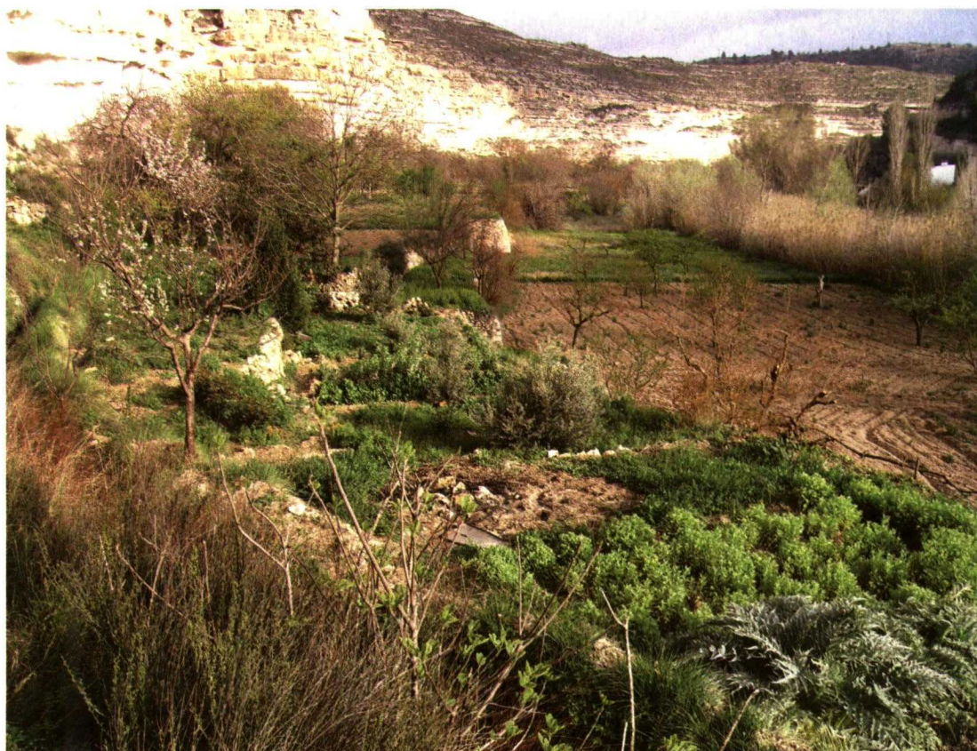
Huertas tradicionales en Jorquera (Albacete).

Las tierras de secano menos profundas se dedican a cereales como cebada y avena o legum-