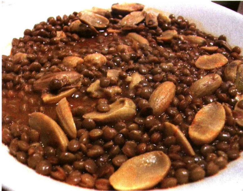
Lentejas con bellotas, un plato ancestral.

A partir de los ecosistemas climáticos ibéricos obtuvimos nuestros primeros alimentos, bellotas, caza... La neolitización supuso la incorporación de alimentos de origen agrícola domesti-