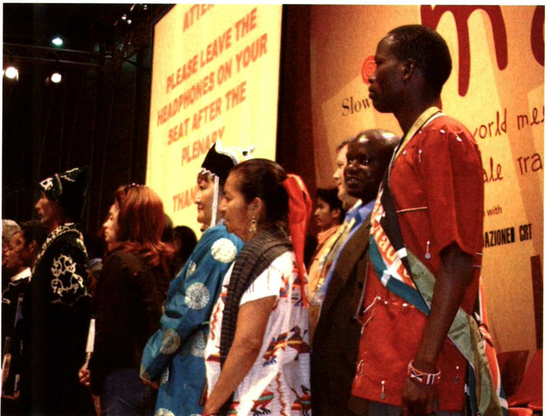
Feria bianual de Terra Madre de Slow Food.

Esos socios se comunican a través de la red, pero también en muchos eventos regionales y nacionales, como Algusto en España, SF International Councilors en Marruecos o Slow Motion Food Film Fest en Canadá ( http://www.slowfood.com/international/28/national-and-international-events-calendar ); en Ferias monográficas, como Slow Fish o Slow Chesse y, sobre todo, en Terra Madre , la gran feria bianual que coincide en