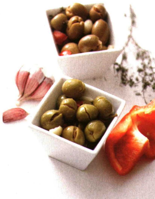
El proyecto Transformados a partir de Recursos Fitogenéticos para la Alimentación y la Agricultura , ha avanzado en la identificación de los transformados elaborados a partir de variedades locales, en particular del olivar, tan importantes para Andalucía. Aceituna aloreña.

tiene como objetivo aportar información, desde sus respectivas especialidades, sobre alimentos locales que necesiten de la difusión y apoyo del colectivo para su recuperación y comercialización. Este grupo de expertos se planteó trabajar en las siguientes líneas: