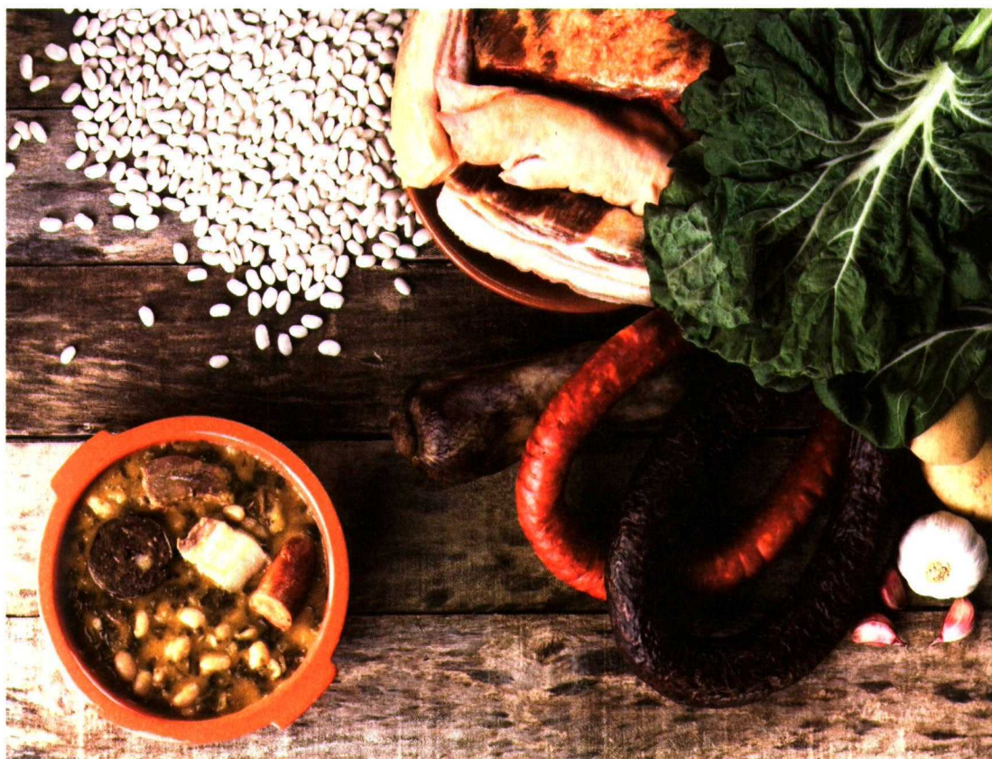
La alimentación de un pueblo son sus cultivos, las variedades que producen y la forma de transformarlos y cocinarlos. Cocido montañés.

Turin con el Salón del Gusto ( www.terramadre.org ). Ya en su primera edición de 2006 reunió a 8487 personas, de las que 4803 eran campesinos, ganaderos y pescadores pertenecientes a 1583 Comunidades del Alimento de 150 países, además de 441 investigadores y docentes en representación de 225 universidades, 2320 observadores de ONG y 1000 periodistas. A partir de entonces no ha hecho sino crecer, al igual que se han multiplicado los temas tratados en sus talleres multilingües. A lo largo de las tres ediciones que ha habido hasta el momento, se ha hablado, entre otras cuestiones, de agroecología, biodiversidad, acceso al mercado, redes, estrategias, políticas alimentarias, educación del gusto y se ha debatido sobre agua, pesca, cereales, especias y una larga lista de alimentos, con sus productores como protagonistas.