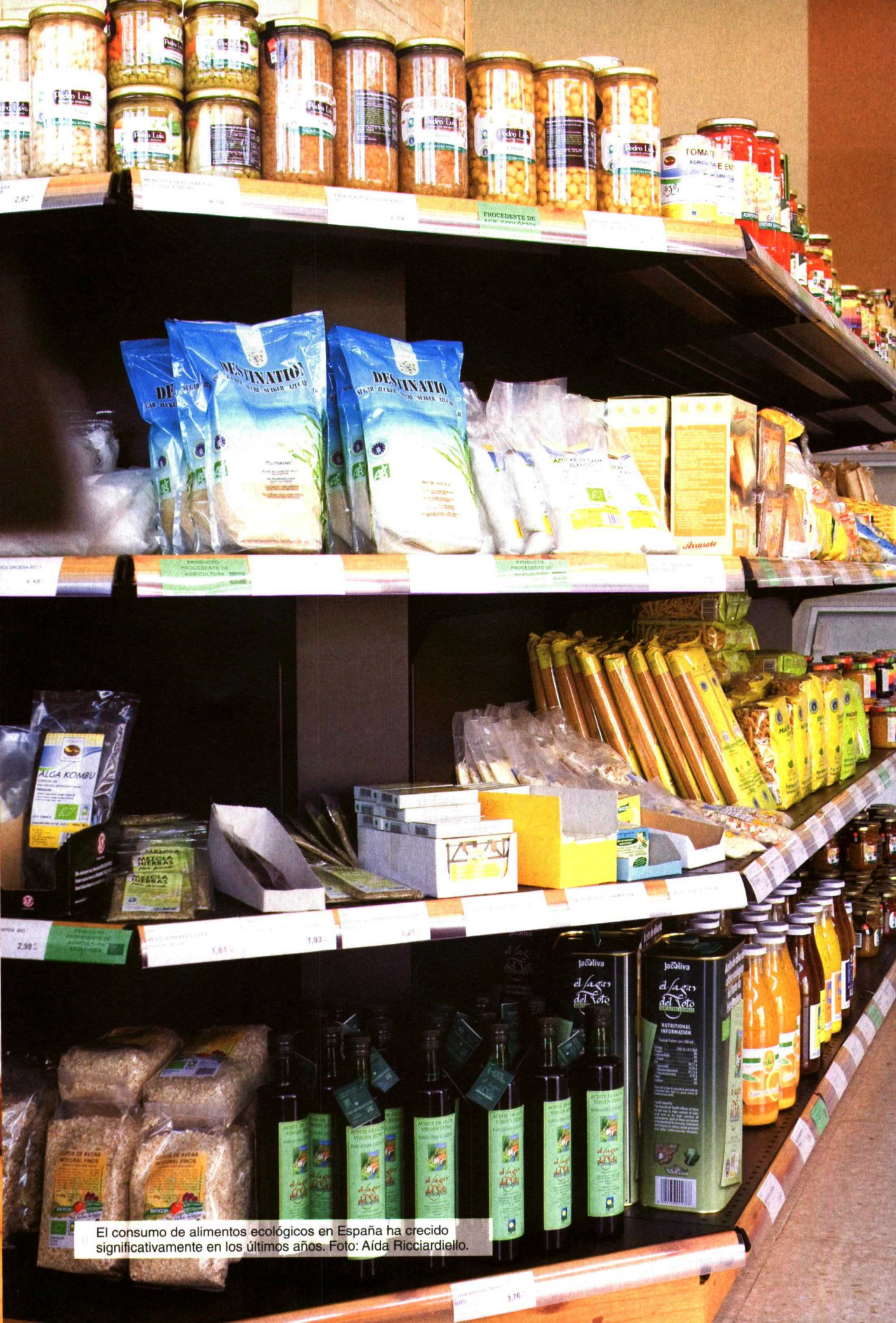
El consumo de alimentos ecológicos en España ha crecido significativamente en los últimos años.