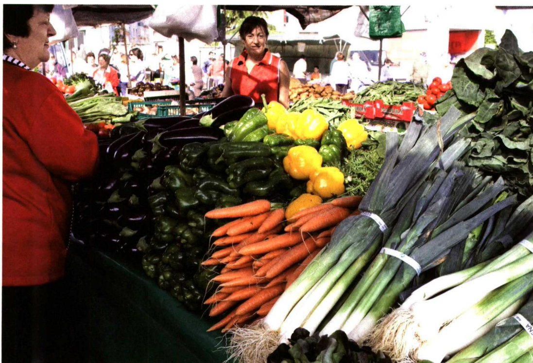
La producción ecológica se distingue, entre otras cosas, por su origen conocido, local, autóctono, artesano, de la tierra, auténtico, etc.