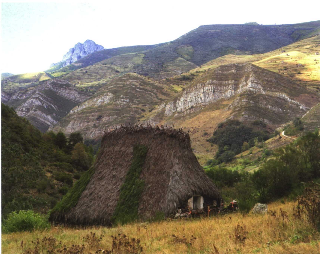
La escasez de otras oportunidades de empleo local en zonas rurales aisladas es una singularidad de relieve que aportan los ecosistemas para vertebrar espacialmente los asentamientos de la población, mitigando el abandono por sus habitantes de las zonas rurales marginales.

finales (PF) que demandan los usuarios actuales de un ecosistema es clave para la medición rigurosa de la RT que aporta a la sociedad en un tiempo y un lugar concretos. En el ecosistema también se generan producciones intermedias (PI) que son consumidas en el mismo periodo para ofrecer las PF del ecosistema. Esta distinción entre PI y PF es indispensable para poder llegar a estimarse valores de renta y capital sin incurrir en dobles contabilizaciones. Sin embargo, con frecuencia esta distinción no se