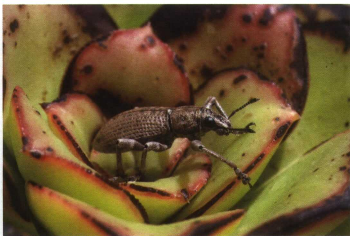
El número de endemismos en islas oceánicas es siempre elevado, particularmente en insectos. Herpisticus , género de gorgojo endémico de las islas Canarias.

nueva tecnología en la que esta audiencia está implicada: la conservación (de la naturaleza), con sus luces y sus sombras.