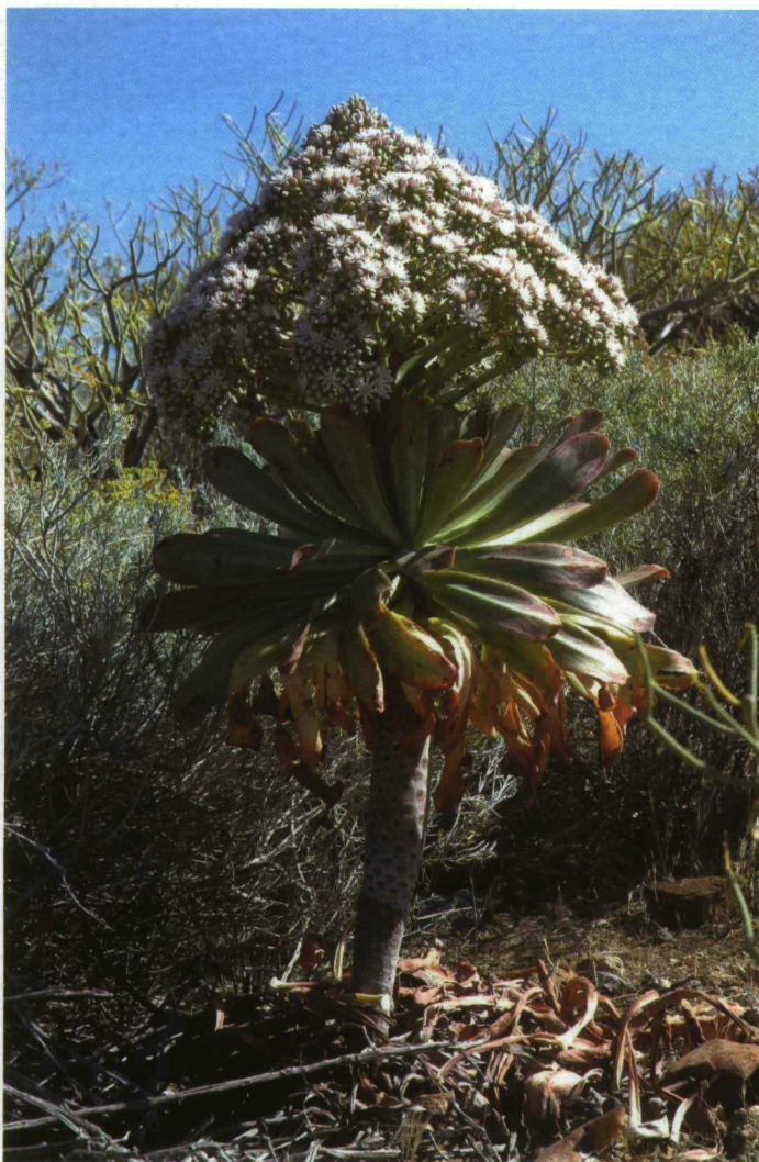
El aislamiento de las islas oceánicas ha propiciado la formación de muchos endemismos. Bejeque endémico de la isla de Tenerife.

la que suele pasar inadvertida, la provocan las especies invasoras introducidas involuntariamente. Es prácticamente imposible revertir la situación, y a lo sumo podemos aspirar a reparar algo del daño causado. Lo que, en principio, sí está en nuestras manos, es no sacrificar más biodiversidad y evitar los impactos innecesarios de cara al futuro. Este es el reto del desarrollo sostenible en cualquier sociedad moderna, sólo que en las islas adquiere un matiz especial. En cierta ocasión, y refiriéndome a mi tierra, escribía: "Canarias no puede ser homologada a un territorio cualquiera. Desarrollar en Canarias es como jugar a la pelota en una tienda de porcelana. Es una cuestión de ciencias naturales, no de chauvinismo" (Machado, 1992). La metáfora es apli-