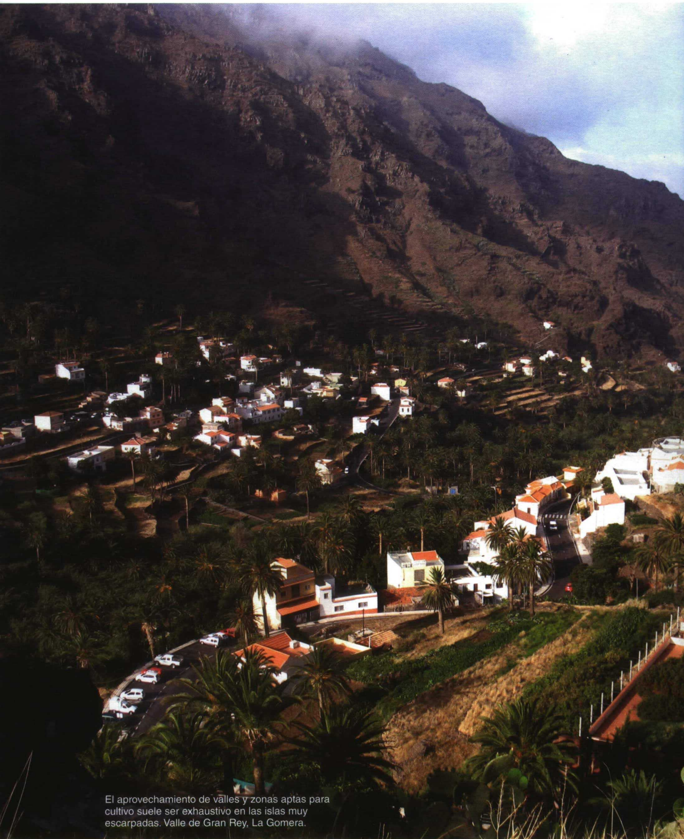
El aprovechamiento de valles y zonas aptas para cultivo suele ser exhaustivo en las islas muy escarpadas. Valle de Gran Rey, La Gomera.