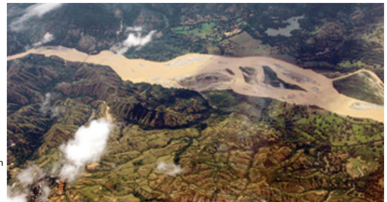
[Deforestación para ganadería en los Andes colombianos]