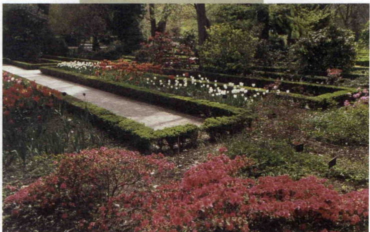
El paisaje colectivo moderno se inspira en los jardines y parques históricos y en las formas que fueron creadas en su día por motivos sociales diversos. Real Jardín Botánico.

Desde 1994, el Comité del Patrimonio Mundial avala una concepción de cultura, compartida por antropólogos y etnólogos, que permite abarcar conjuntos complejos, que son la traducción espacial de las organizaciones sociales, los modos de vida, las creencias, los conocimientos y las representaciones de las distintas culturas pasadas o presentes