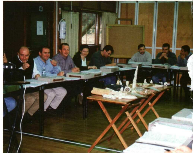
El CENEAM trabaja para mejorar el desarrollo profesional de personas cuyo trabajo está vinculado con el medio ambiente.

Asimismo, en 2008, se ha trabajado para aumentar la temática de los cursos a distancia modalidad on-line, como resultado, se han puesto en marcha los cursos: “Técnicas de investigación de causas de incendios forestales” y “Accesibilidad a Espacios Naturales Protegidos”.