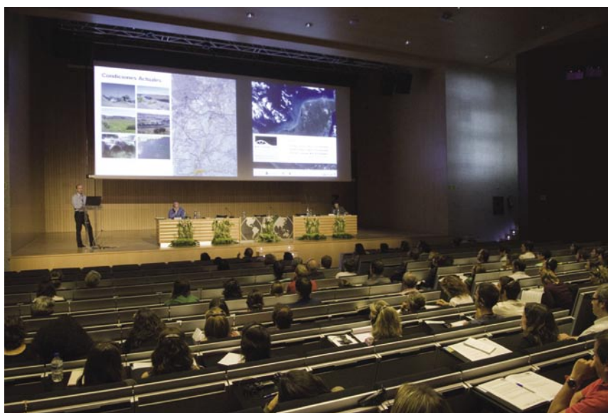
Los diferentes temas propuestos en las conferencias y comunicaciones y la distinta procedencia y formación de los ponentes, han permitido que durante unos días la EXPO de Zaragoza fuese un punto de referencia en materia de agua y paisaje.