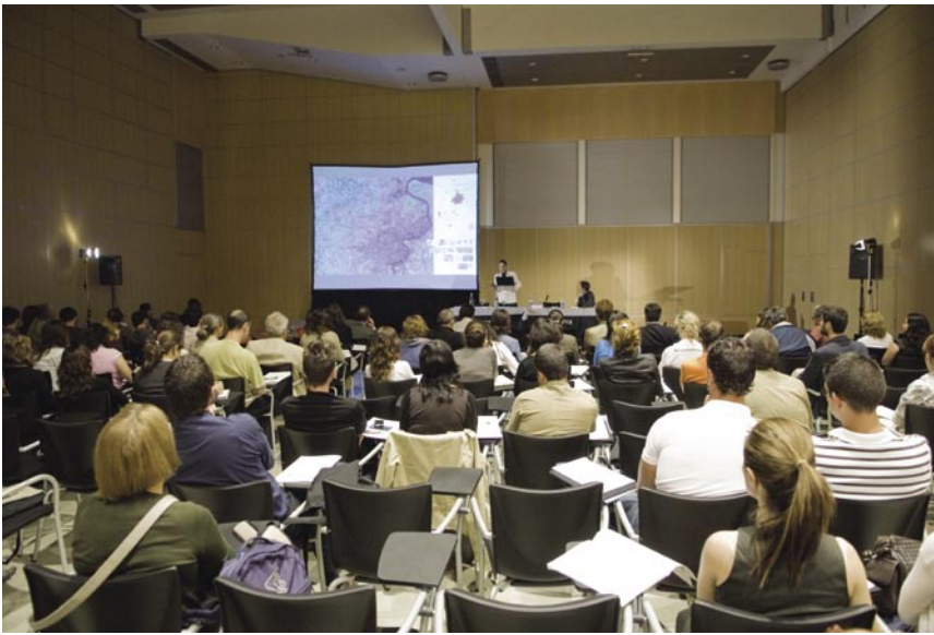
Las Jornadas sobre paisaje, agua y sostenibilidad se desarrollaron durante los días 26, 27 y 28 de junio.

y proyectual en las Jornadas. Finalmente, la tercera de las Jornadas, con el título “Contando el agua...” asumió las tres principales acepciones de la palabra contar en castellano: cuantificar, valorar económicamente y describir o narrar, para incorporar en las Jornadas los acercamientos al paisaje y al agua desde disciplinas vinculadas a su análisis, a su gestión o a su uso como elementos de expresión artística o literaria. Paralelamente se contó con Comunicaciones basadas en el Convenio Europeo del Paisaje y agrupadas en 10 áreas temáticas en las que se incluyeron trabajos de