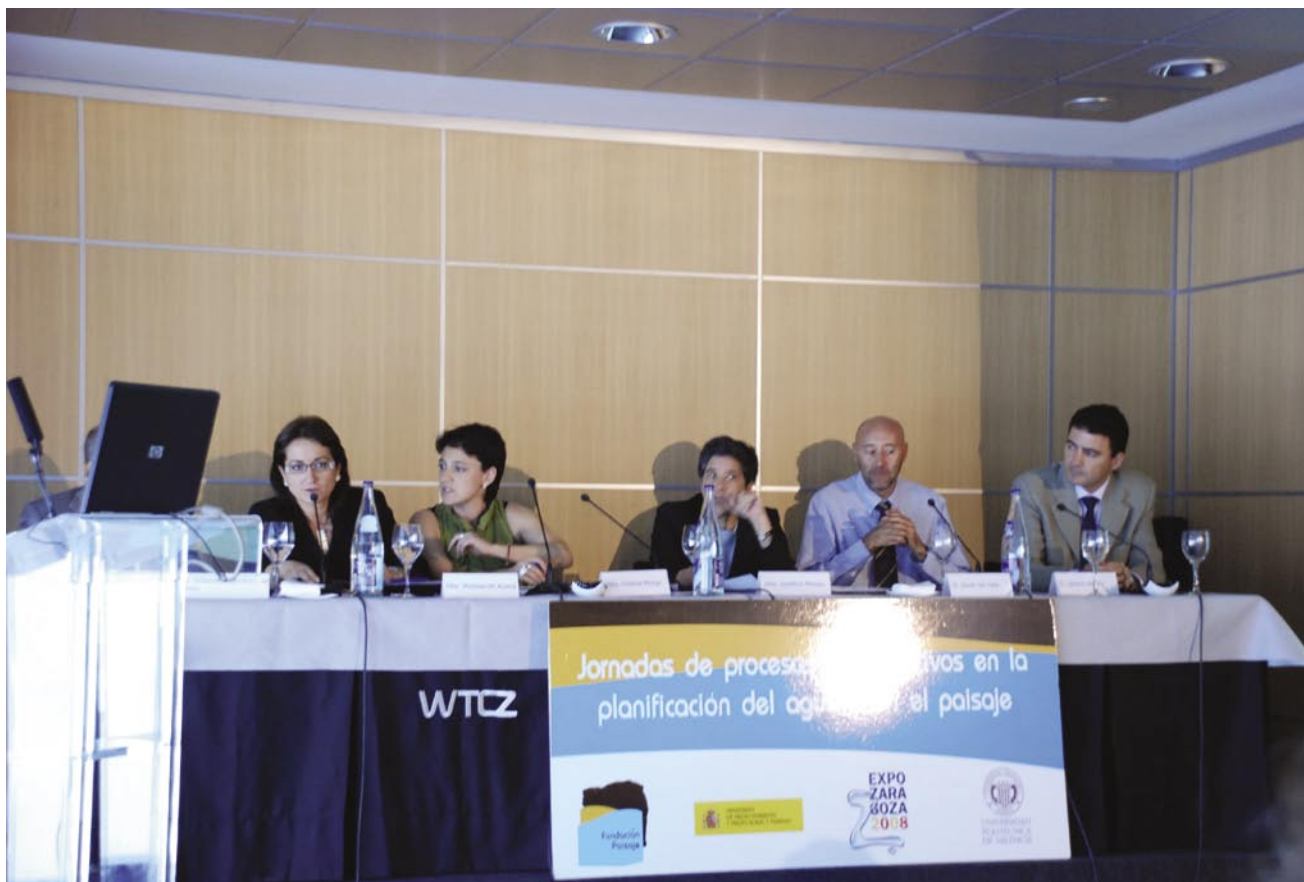
Una de las mesas de debate de las jornadas sobre "Procesos participativos en la planificación del agua y en el paisaje".

reclama como imprescindible la "identificación y cualificación de los paisajes propios en todo el territorio" (Art. 6.C), exigencia que se está desarrollando con notables resultados en diferentes países, como Reino Unido, Francia, Irlanda, Eslovenia y también en España (Atlas de los paisajes de España, Catálogo de paisajes de Cataluña, Mapas de Paisaje de Aragón, Mapa de los paisajes de Andalucía, Inventario de paisajes singulares y sobresalientes del País Vasco...). A su vez estos trabajos han propiciado el desarrollo de metodologías referidas a la valoración o cualificación de los paisajes y para el seguimiento de las dinámicas paisajísticas. Para ello es necesario conocer la opinión de la ciudadanía sobre el estado de sus paisajes.