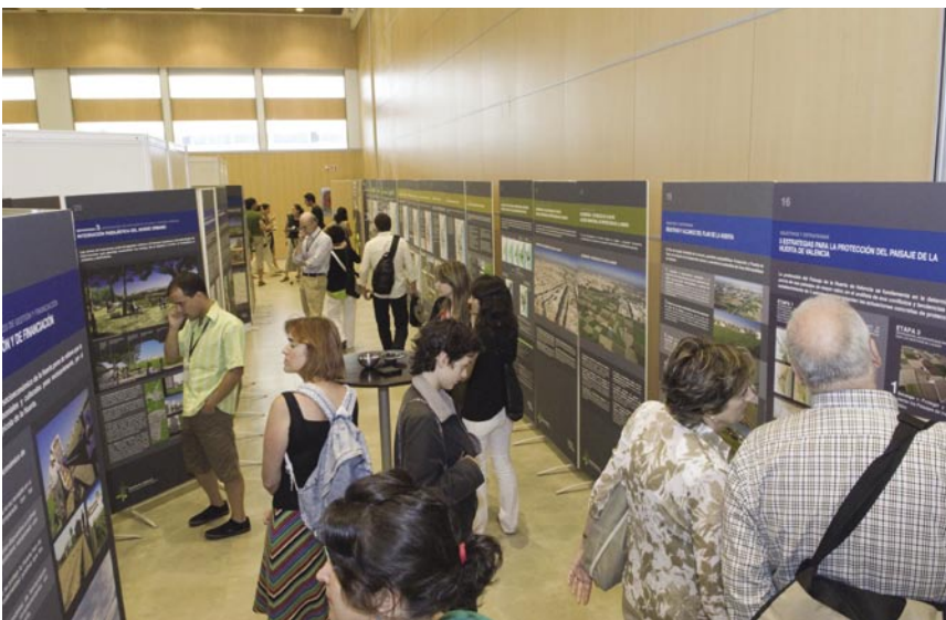
Paneles explicativos sobre el Plan de Acción Territorial de la Huerta de Valencia.

La segunda de las Jornadas se centró en proyectos y planes vinculados a la ordenación, gestión o protección de paisajes asociados al agua y se inició con una ponencia dedicada al patrimonio hidráulico en los jardines históricos portugueses y sus posibilidades de reinterpretación en el jardín contemporáneo. La Directora General de Paisaje de la Comunidad Valenciana presentó el Plan de Acción Territorial de Protección de la Huerta de Valencia, un trabajo de especial significación en la ordenación del territorio con criterios medioambientales, culturales y paisajísticos, que tuvo su continuidad en la ponencia impartida por el actual Jefe de Programas de Gestión de la Mancomunidad de Municipios del Área Metropolitana de Barcelona, quien explicó los distintos proyectos y programas asociados a la ordenación del río Llobregat, así como en la conferencia dedicada al estudio “El renacer del río Tajo”, trabajo desarrollado conjuntamente por