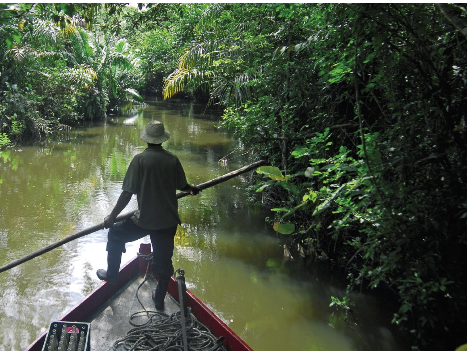
Reserva de Biosfera Río San Juan, en Nicaragua. En la foto el río Papaturre que está en el Refugio de Vida Silvestre Los Guatusos, una de las siete áreas protegidas de la Reserva Biosfera.

Las Reservas de Biosfera se convierten así, en muchos países, en lu-