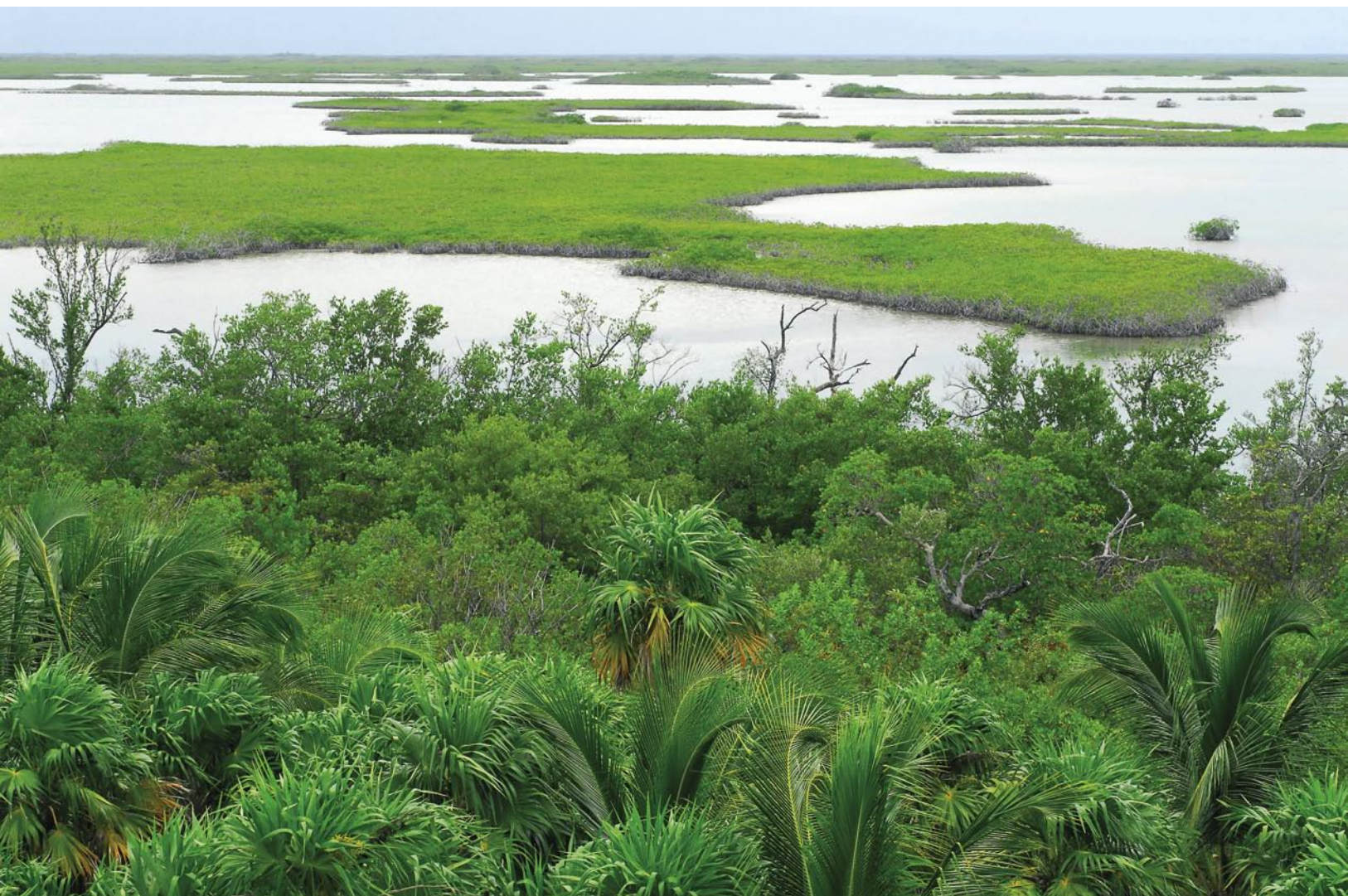
Reserva de Biosfera de Sian Ka'an, en México en la Península de Yucatán. El nombre significa en maya "donde empieza el cielo".

el desarrollo sostenible, las migraciones humanas, la sostenibilidad económica y el papel de las reservas de biosfera como laboratorios del desarrollo sostenible.