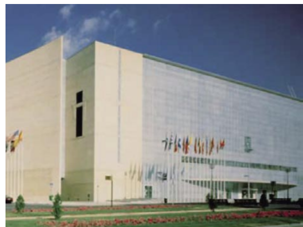
Palacio Municipal de Congresos de Madrid donde se celebrará el III Congreso Mundial de Reservas de Biosfera.

El reto de insostenibilidad al que se enfrenta la humanidad en este momento histórico hace más relevante el papel de la RMRB, que si bien sólo abarca lugares concretos, puede extender su incidencia en la medida en que la sociedad se comprometa con estos ensayos, cuyos resultados son aplicables a amplios territorios. 33