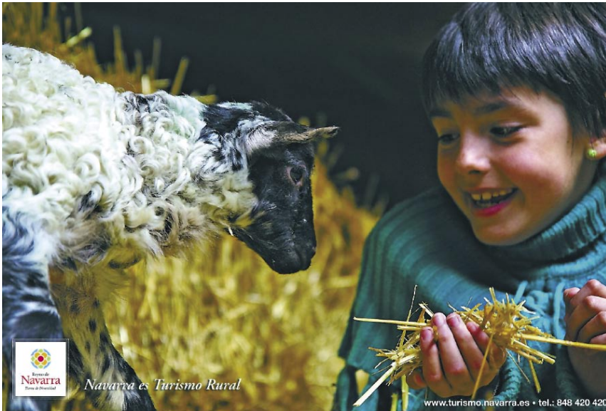
La cultura ambiental, más allá de las modas e intereses diversos, se está posicionando como auténtica dorsal de la nueva racionalidad sostenible.

La sociedad posmoderna se caracteriza por el declive de las instituciones jerárquicas y la rigidez de las normas sociales y por la expansión del reino de la elección individual y la participación de las masas. En la sociedad posmoderna, el sistema de valores, del énfasis en el logro económico como prioridad, está dando paso a una importancia cada vez mayor de la calidad de vida. Otro cambio básico de dirección de esta tendencia en el nuevo modelo de sociedad, ha sido el giro que han experimentado las normas y motivaciones predominantes que fundamentan la conducta humana, algo que aporta luz, también, al objeto de este artículo.