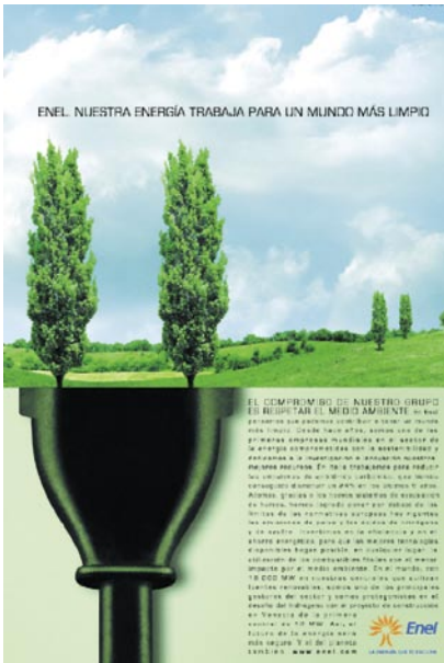
Hemos pasado de la comunicación de los productos a las marcas en los años 80 del siglo pasado, de las marcas a los valores en los años 90 e inicios del siglo XXI. Ese es el escenario predominante actual.

negocio publicitario, en los que los sujetos y no meros públicos, los ciudadanos y no meros consumidores, asumen el papel protagonista que desencadenan y provocan los flujos y nuevas redes de la sociedad mediática en que vivimos. Los ambientes adquieren su relevancia más allá del mero efectismo teatral de otros tiempos y los nuevos valores orientan las nuevas prácticas sociales. Lo simbólico adquiere privilegio sobre la meramente material. El consumo simbólico adquiere sesgo identitario y no mera participación alienante de un