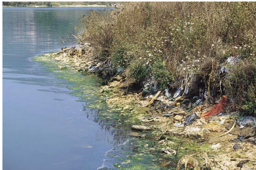
Los ríos han sido uno de los medios naturales más afectados por el crecimiento económico y social.

guía para el diseño y ejecución de programas de voluntariado ambiental en ríos y riberas. Esta guía, cuya coordinación ha corrido a cargo de WWF/Adena, pretende establecer recomendaciones y pautas para conservar y mejorar el patrimonio natural y cultural en el marco de un desarrollo sostenible; promover la participación ciudadana a través de grupos y entidades de voluntariado