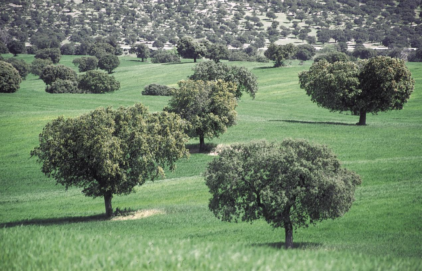
Dehesa. Soto de Viñuelas. Madrid.

Consejo de Europa a través de sus diferentes Comités, venían prestando atención a los paisajes naturales y culturales. Sin embargo su punto de partida es la Carta del Paisaje Mediterráneo (Carta de Sevilla, 1992) impulsada por tres regiones europeas (Andalucía, Languedoc-Rosellón y Toscana). A partir de ella, el Congreso de Poderes Locales y Regionales (CPLR) del Consejo de Europa propone elaborar “una convención marco sobre la gestión y la protección del paisaje natural y cultural de toda Europa”, que se traduce en el mandato a un Grupo de Trabajo integrado por representantes de instituciones, de los poderes locales y regionales y de expertos. Tras su obligada consulta a los diferentes órganos del Consejo de Europa, el Comité de Ministros adopta definitivamente el texto en octubre de 2000.