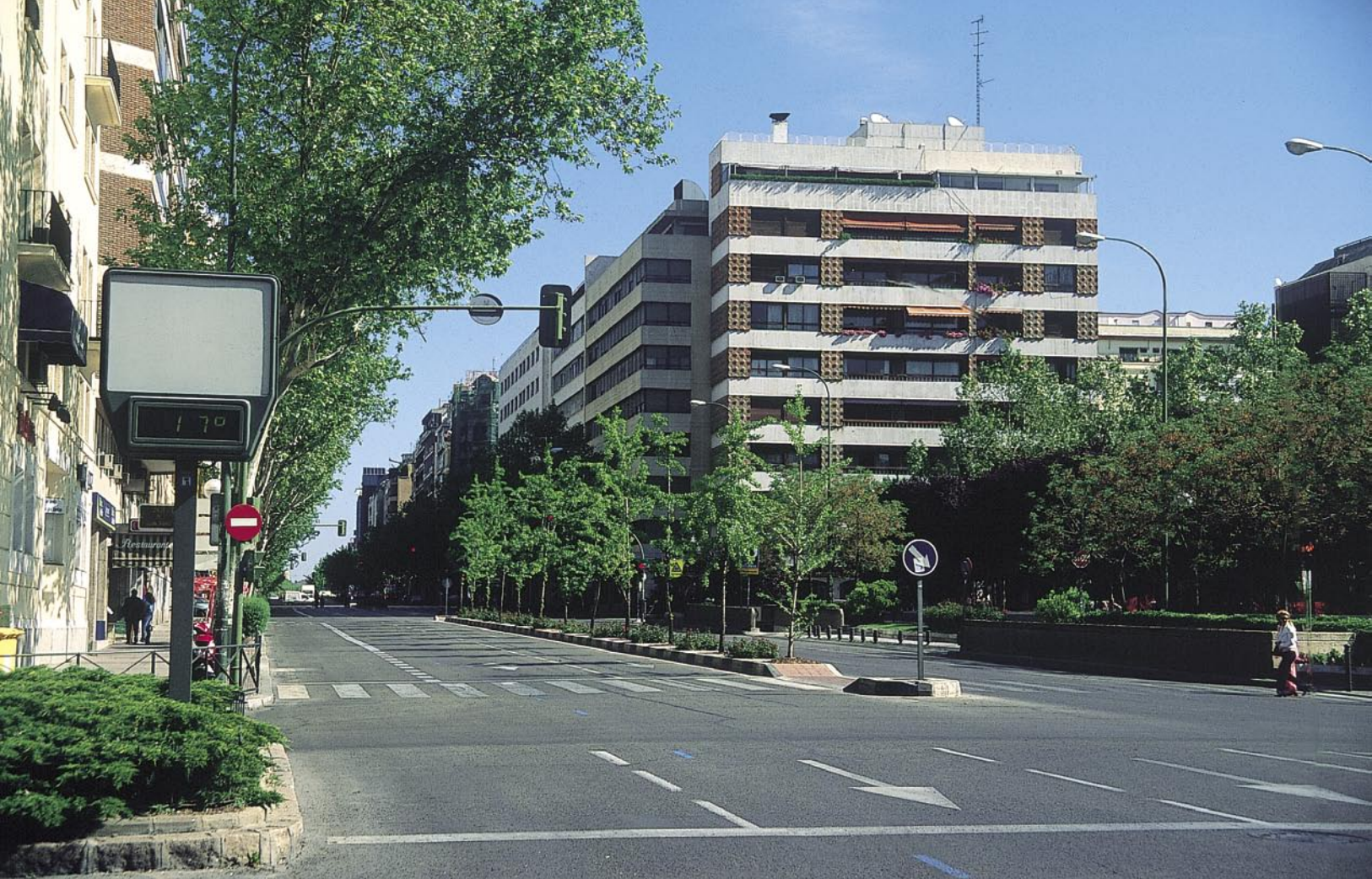
Paisaje urbano. Barrio de Salamanca. Madrid.

en ese amplio ámbito de la Europa continental que forman por los 42 miembros que integran el Consejo de Europa.