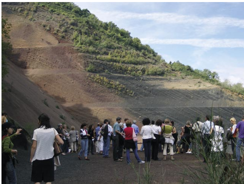
Visita de los participantes en los Talleres al Volcán Croscat, que ha sido objeto de un proyecto de recuperación.

España, elaborado y editado por el Ministerio de Medio Ambiente mediante un convenio de cooperación con la Universidad Autónoma de Madrid, como una de las herramientas de identificación de los paisajes que recomienda el Convenio; y también una serie de