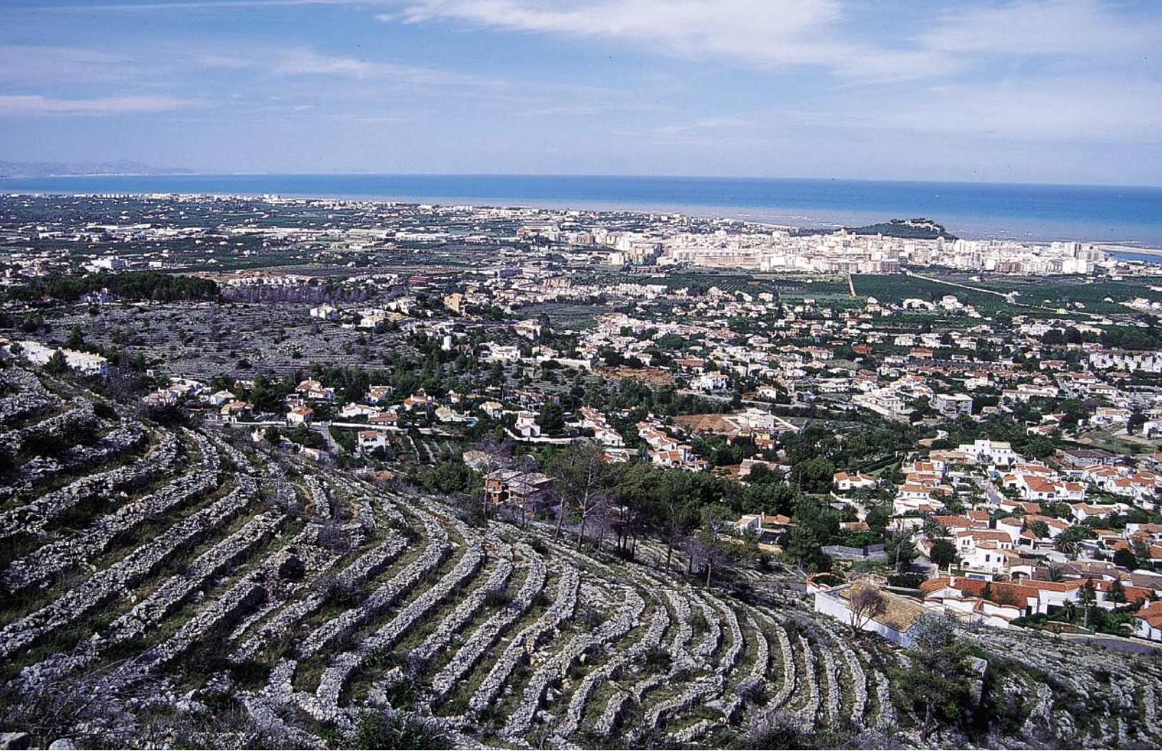
El paisaje al que se dedica el Convenio es sobre todo el de un espacio transformado y transformable resultado de la acción humana en el medio. Parque Natural del Montgó. Alicante.