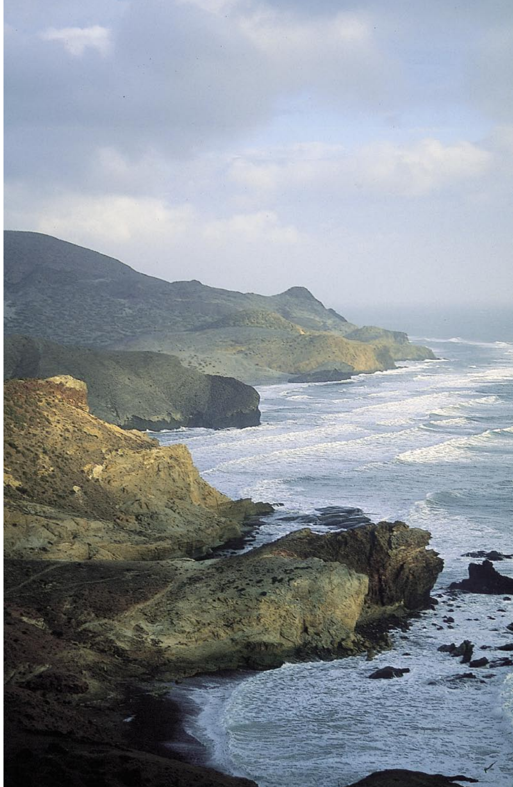
Steiner alerta sobre la acelerada transformación que están sufriendo los paisajes. Cabo de Gata.

Adoptado en Florencia (Italia) por el Consejo de Europa, en octubre de 2000, el Convenio Europeo del Paisaje entró en vigor el 1 de marzo de 2004, una vez ratificado por más de 10 Estados