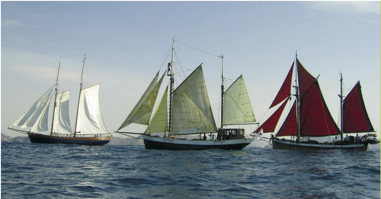
La "MORENA", el "TOFTEVAAG" y el "ELSE", los barcos del proyecto LIFE. Los tres antiguos pesqueros reconvertidos para la investigación de cetáceos y tortugas y para la educación ambiental.

o la recuperación de esqueletos de cetáceos enterrados. Sin todos ellos el proyecto no hubiera sido el mismo Solo e los barcos "Toftevaag" "Eise y "Elsa han participado durante las campañas de monitorización en el mar de mas de una semana hasta 800 voluntarios, lo que supone más de 70.000 horas de trabajo.