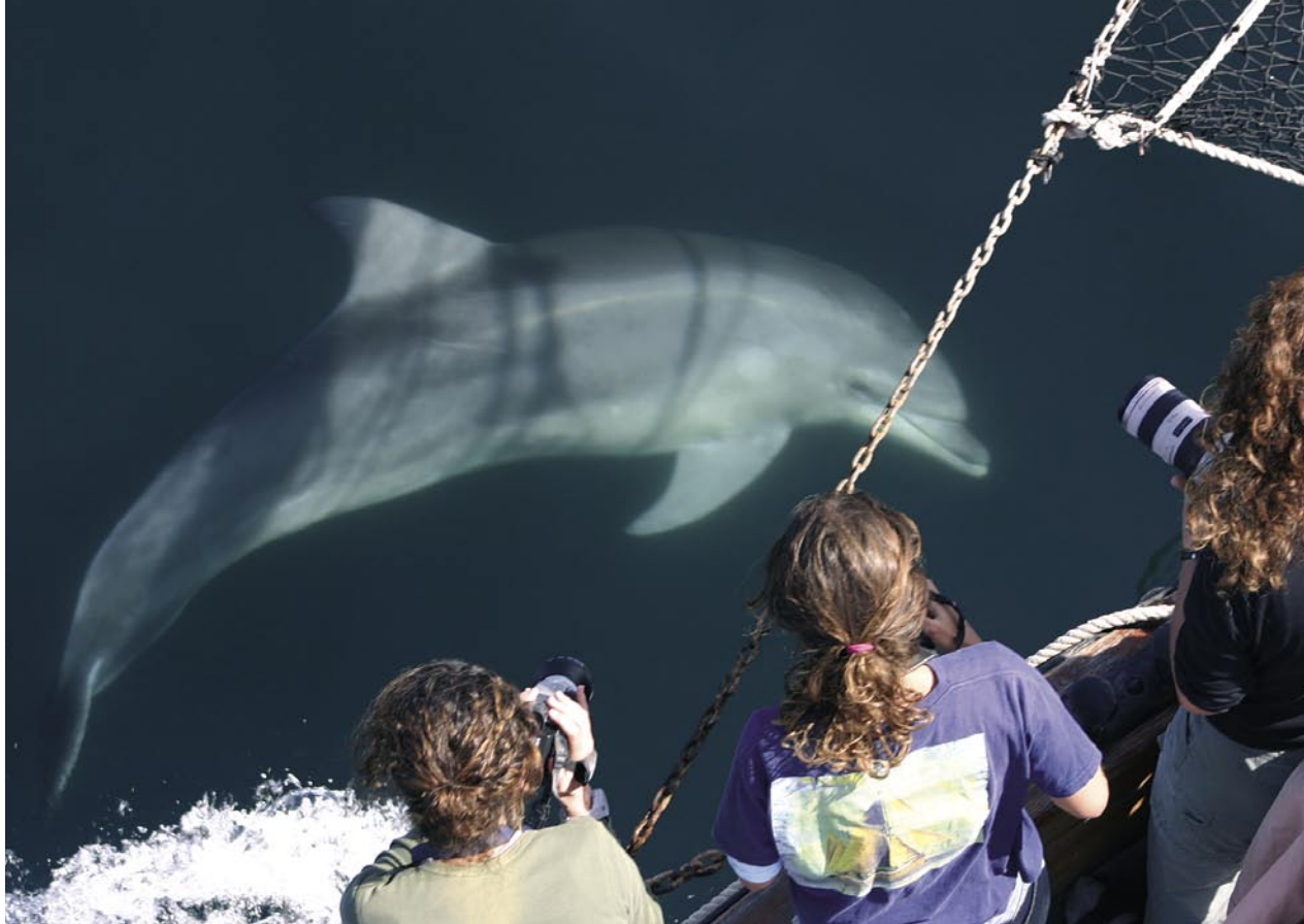
El delfín mular es u□ Catálogo Nacional de Especies Amenazadas. Uno de los productos del proyecto ha sido la realización del Plan de Conservación de esta especie en Andalucía y Murcia.

gigantescos, y las fronteras que marcamos los humanos tienen poca relevancia. Por ello es preciso que nuestras acciones de conservación se adecuen a esta escala transoceánica. Esto requiere una coordinación en el plano vertical desde las políticas y estrategias de ámbito internacional hasta la realización de actuaciones a escala regional. A su vez, en cada plano internacional, nacional y regional, es necesaria una coordinación entre administraciones y otras partes implicadas. Y es precisamente esta coordinación el principal cometido de los planes de gestión, asegurando una máxima eficacia de la inversión económica y humana para la consecución de unos objetivos de conservación.