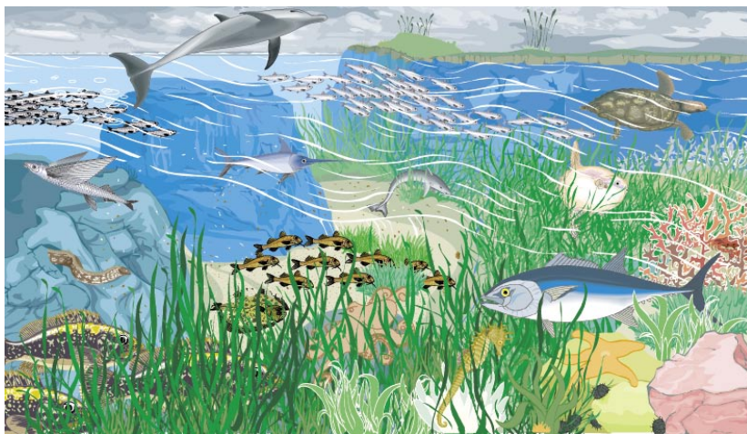
La filosofía del proyecto está basada en un enfoque sobre la importancia del ecosistema. Los delfines y las tortugas son usados como piezas "llave" para conservar el medio marino.

pescadores a aquellos sobre cetáceos y tortugas pasando por otras especies marinas y por temas de conservación del mar y sus especies. Unas pinceladas de muchos aspectos para que todos se puedan ver reflejados en el mismo. Un documento muy visual con más de 500