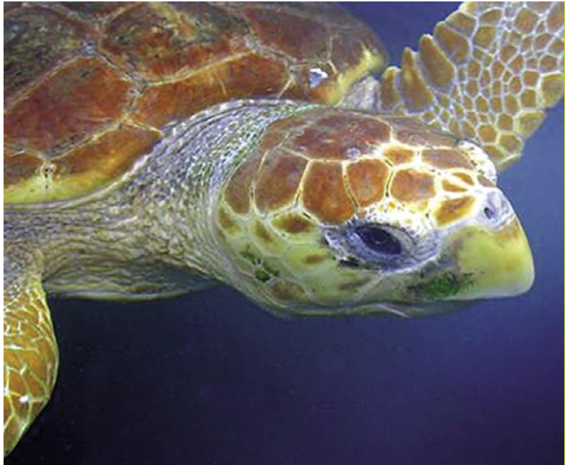
La tortuga boba Caretta caretta ha sido una de las especies objetivo del proyecto. Incluida en el Anexo II de la Directiva Hábitat su principal amenaza en Alborán y Golfo de Vera es la captura accidental en palangre de superficie. Muchas de las acciones del Plan de conservación elaborado van encaminadas a minimizar ese impacto.

Andalucía para dar a conocer y para aprender nosotros, hemos pasado también por los Centros de Recuperación de fauna marina, por las oficinas de todas las administraciones desde ayuntamientos a ministerios, desde cofradías de pescadores o asociaciones a empresas, para hacer participara a todos, porque todos tiene algo que decir y hacer.