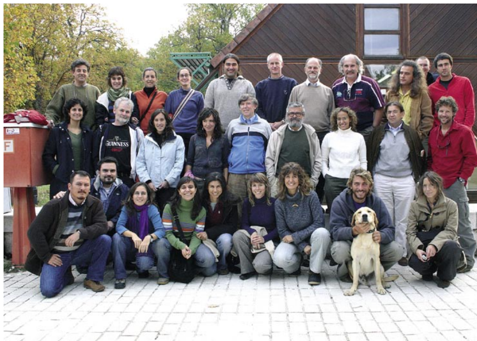
Parte del equipo LIFE y del Comité científico en una reunión del proyecto en el CENEAM de Valsain en diciembre de 2005.

“Todos por la Mar” ha sido el eslogan del proyecto, su filosofía. “Conocer para conservar” la piedra angular para conseguirlo