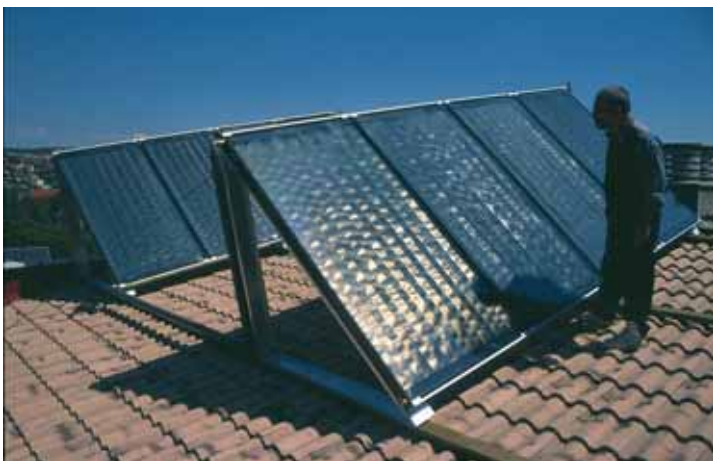
Debe fomentarse la utilización de energías alternativas como la instalación de paneles solares.

En el caso concreto de España, la contratación pública está regulada por la Ley de Contratos de las Administraciones Públicas, cuyo texto refundido fue aprobado por Real Decreto Legislativo 2/2000 de 2 de junio, desarrollado por su Reglamento General aprobado por el R.D.