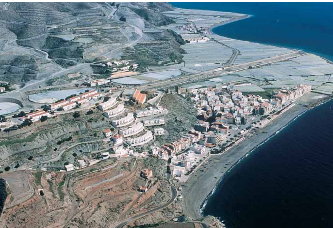
Los pequeños deltas del Mediterráneo deberían haberse preservado sin edificaciones

Un plan estratégico requiere la definición de un