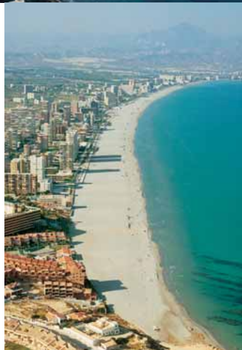
Playa de San Juan después de la regeneración

Por su propia naturaleza un Plan de Costas puede orientarse desde una perspectiva conservacionista y su paradigma sería la recuperación a ultranza de los espacios naturales, pero la costa es soporte de actividades económicas de importancia fundamental para la economía: el turismo, el transporte marítimo, los recursos minerales de la plataforma, la pesca en las aguas territoriales y la acuicultura. El problema se ha generado cuando se ha considerado que cabía todo de forma desmedida: urbanizaciones, industrias, vertidos, recursos sobreexplotados,