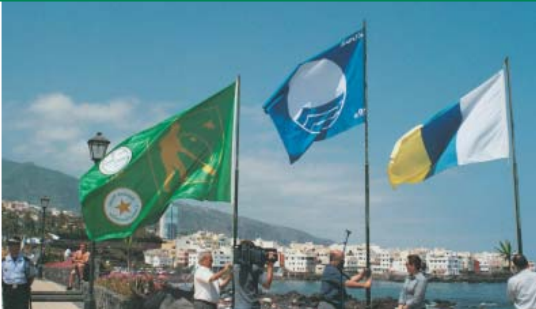
Izado de la Bandera Verde.

Este año 2003, la consolidación de los premios "Bandera Verde-Ciudad Sostenible" ha llevado a FUCI a ir más allá y a buscar una nueva fórmula que permita que las labores más ejemplares en materia de desarrollo sostenible que llevan a cabo empresas, instituciones y personas sean valoradas del mismo modo que los municipios. Así, la FUCI ha convocado por primera vez este año la Edición Especial de la "Bandera Verde-Gestión Sostenible", en colaboración con la Fundación Biodiversidad. Este galardón está destinado a personas, instituciones y empresas especialmente comprometidas con el desarrollo sostenible, y cuyo compromiso sea un referente para