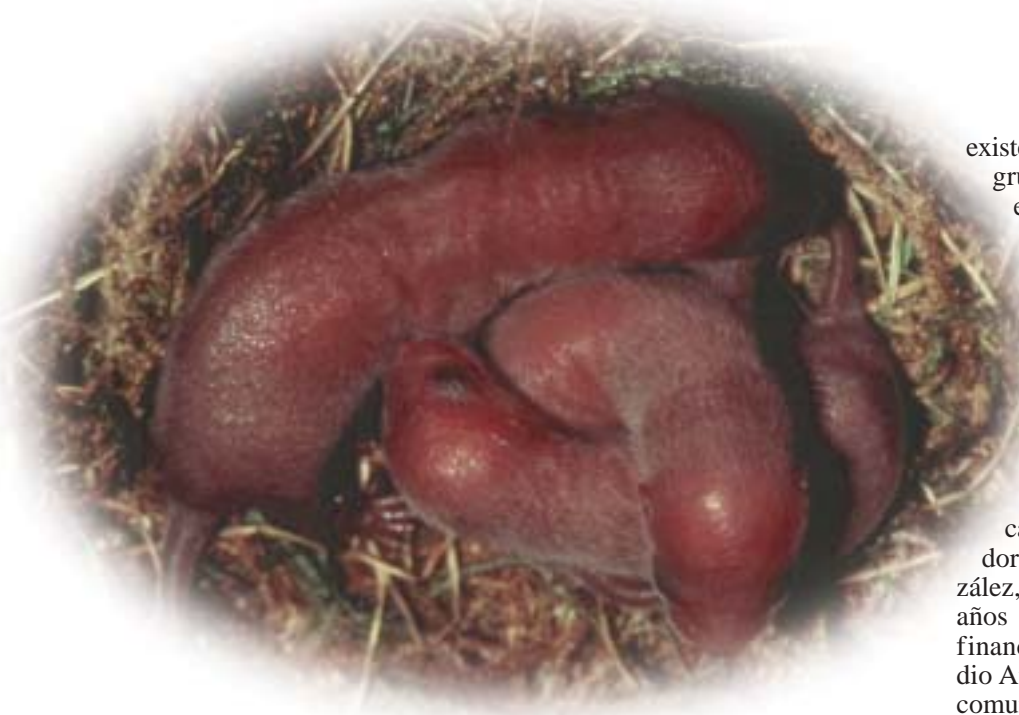
En cada camada nacen entre 3 y 6 crías de visón europeo, ciegas y sin pelo que se amamantan hasta los 30 días.