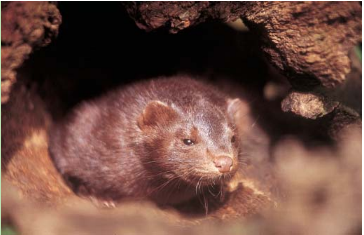
La expansión del visón americano es el principal factor de amenaza para las poblaciones de visón europeo.

Se prevé que en el año 2004 se apruebe la Estrategia para la Conservación del Visón Europeo en España