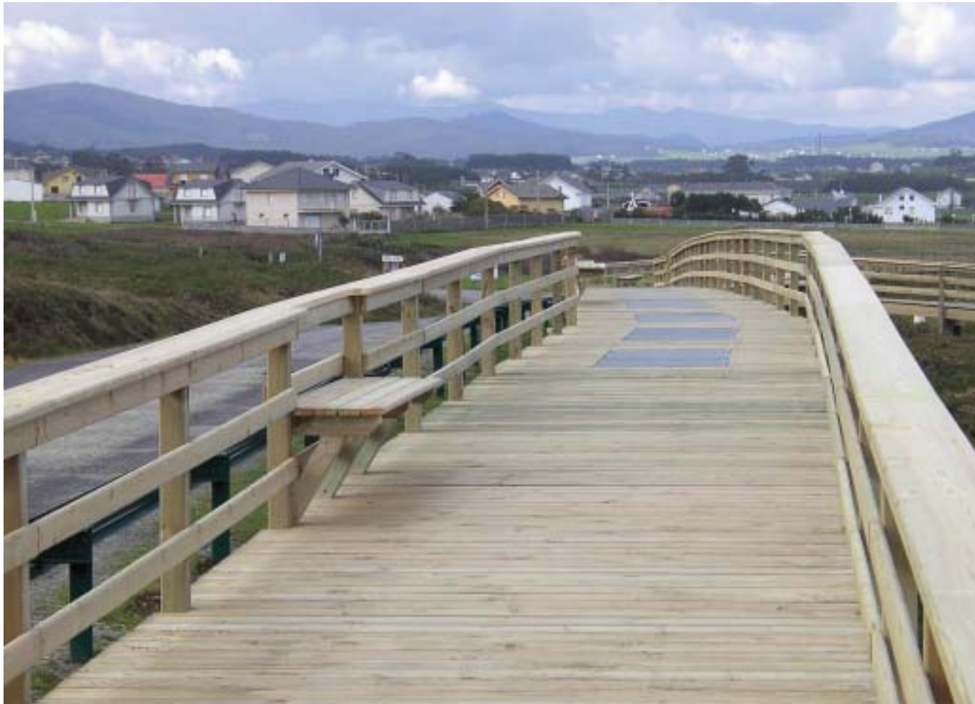
Las pasarelas facilitarán, además, el acceso de las personas con algún tipo de discapacidad.

realiza una intervención en el pequeño regato que conforma el linde entre los dos municipios.