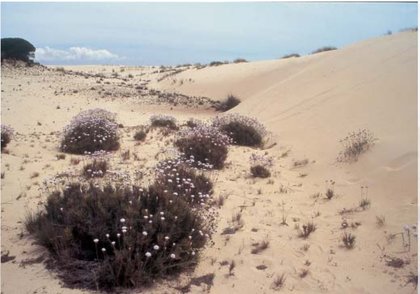
España defendió en el congreso el reto de llegar a conformar una Red de Áreas Protegidas en Iberoamérica. Parque Nacional de Doñana.

transfronteriza y, por otra parte, en el establecimiento de una visión regional para un gran proyecto del manejo integrado a escala continental. La iniciativa quedó bautizada como "La Senda del Puma".