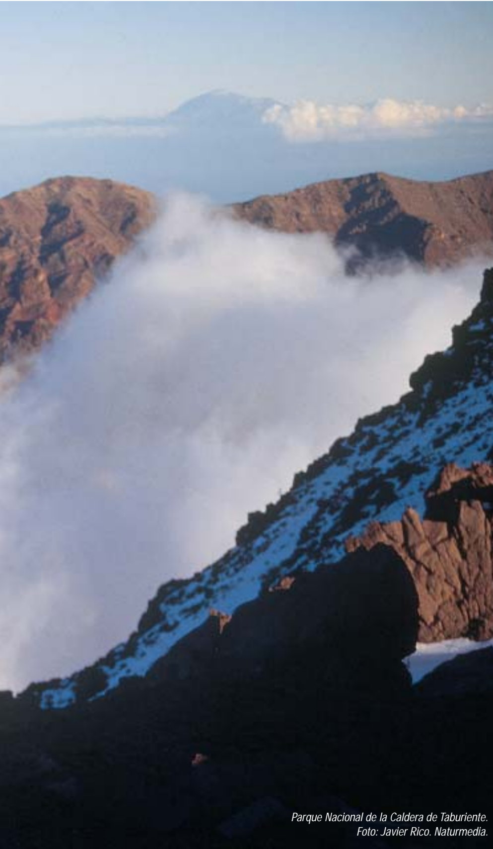
Parque Nacional de la Caldera de Taburiente.