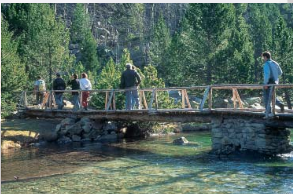
Parque Nacional de Aigüestortes i Estany de Sant Maurici.

España consolidó en este congreso su posición entre los máximos especialistas en parques y afianzó su capacidad de liderazgo a escala iberoamericana. Parque Nacional de Cabañeros.