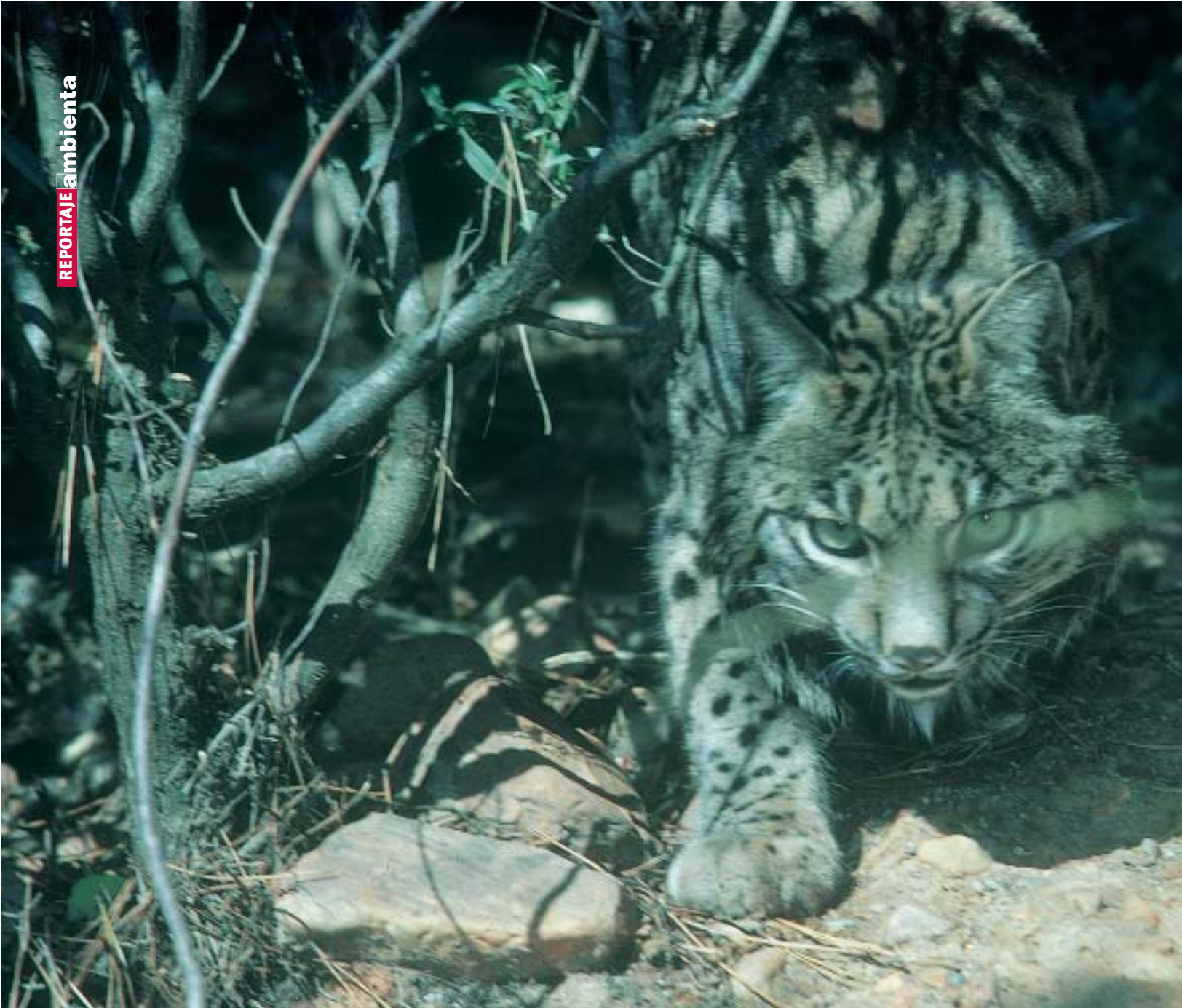
El lince ibérico es el felino más amenazado del planeta.

Uno de los aspectos más importantes de este Convenio es el de impulsar el Plan de Cría en Cautividad del Lince Ibérico