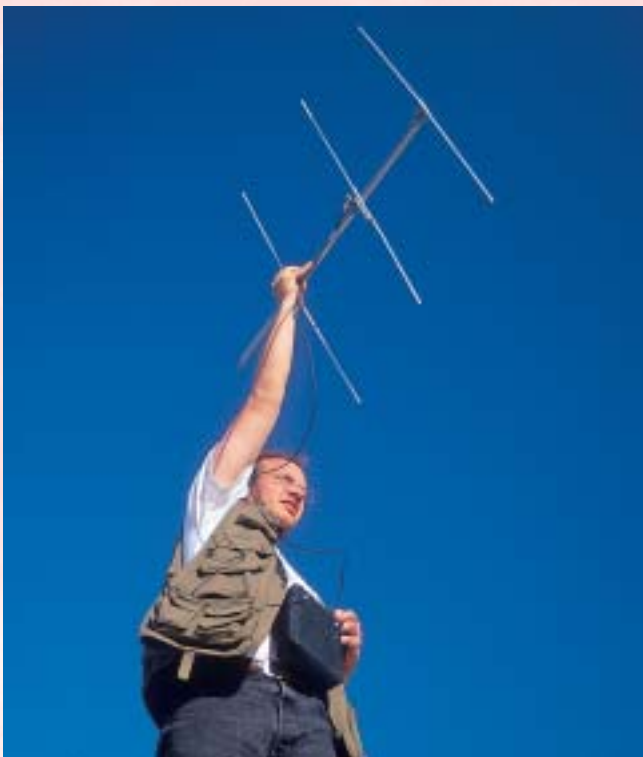
Radioseguimiento de lince ibérico. Estación Biológica de Doñana.

rante este seminario internacional se presentaron los resultados del último censo elaborado de la especie (2000-2002), que indican que la población de lince en la actualidad no supera los 200 ejemplares. Por este motivo, una de las conclusiones más importantes que resultó de ese Seminario fue la de incrementar las acciones de conservación en las dos áreas donde se ha constatado la presencia de hembras reproductoras, en concreto, en Andujar-Cardena y en Doñana.